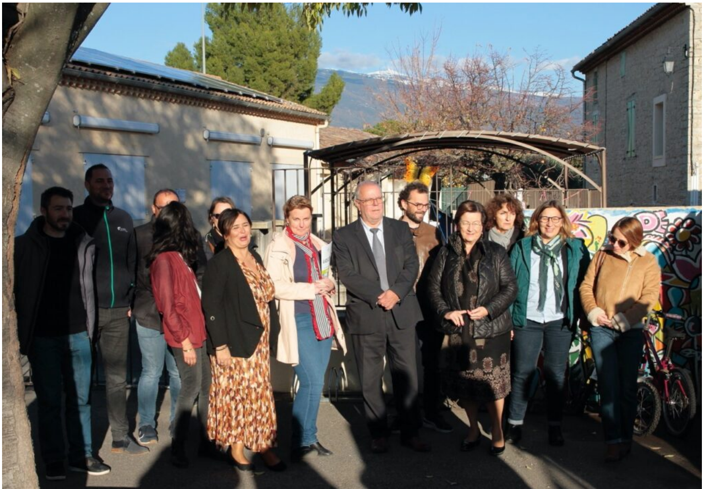
Les représentants de la Cove et les élus du territoire lors de l'inauguration à Saint-Pierre-de-Vassol.

3 projets communaux sont à l'étude dans les villages pour l'installation de centrales photovoltaïques : sur les vestiaires du plateau sportif au Barroux, sur le centre culturel et sportif de Saint-Didier, et sur le parking de la Boiserie à Mazan.