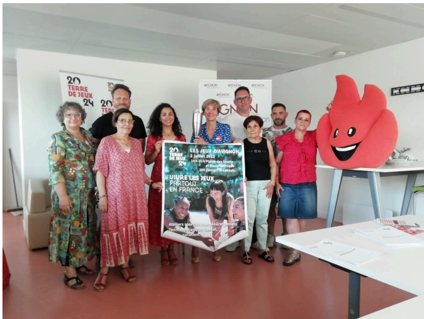
La municipalité d'Avignon lance les 'Jeux d'Avignon', première initiative de la ville sous le label 'Terre de Jeux 2024'.

Le 2 juillet, de 9h à 13h, les Avignonnaises et les Avignonnais pourront traverser les quartiers de la ville en portant la flamme de 'Terre de Jeux'. Le départ sera donné à 9h sur l'île de la Barthelasse, avec un invité de marque : Jérémy Azou , Champion olympique en deux de couple poids léger masculin aux Jeux olympiques d'été de 2016. L'arrivée de la flamme se fera aux Halles Génicoud où diverses animations seront présentes.