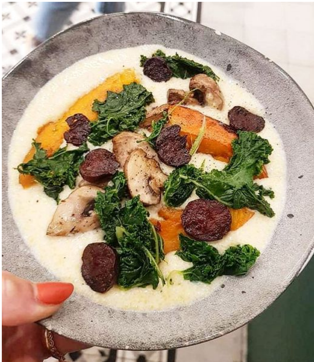
L'eau à la bouche.