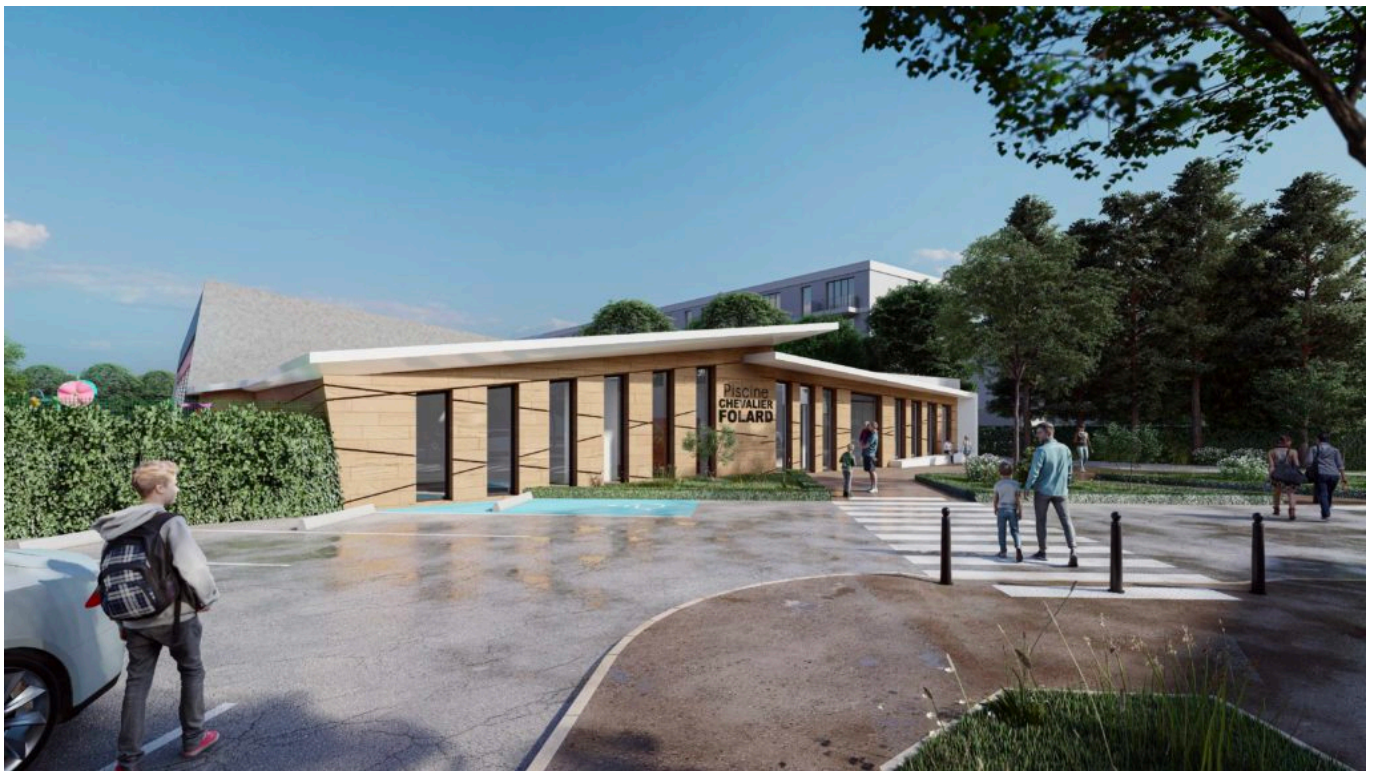
Futur extérieur de la piscine Chevalier de Folard