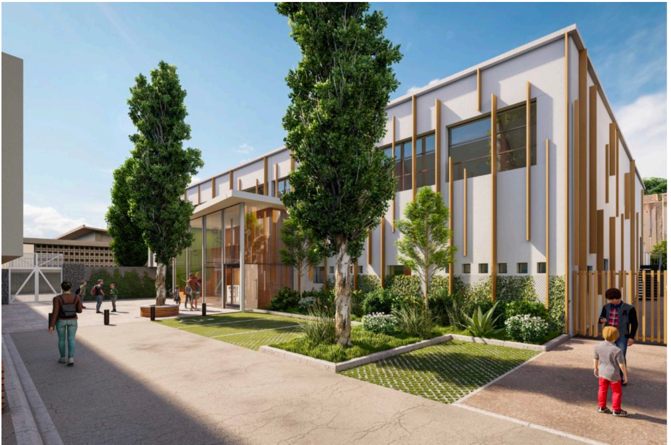
Futur extérieur de la piscine Pierre Reyne à Montfavet

Alors pourquoi conserver ces piscines de quartiers qui, dans le budget communal constituent toujours un coût et jamais de retour sur investissement ? «Bien souvent ce type d'aménagement fait partie des sacrifiés car ils coûtent, opine Cécile Helle, maire d'Avignon. Nous, nous avons choisi de les pérenniser car ils font partie de l'attractivité des quartiers et constituent un élément fort de rénovation de ceux-ci puisque ce sont des lieux de partage, d'animation et de lien social.»