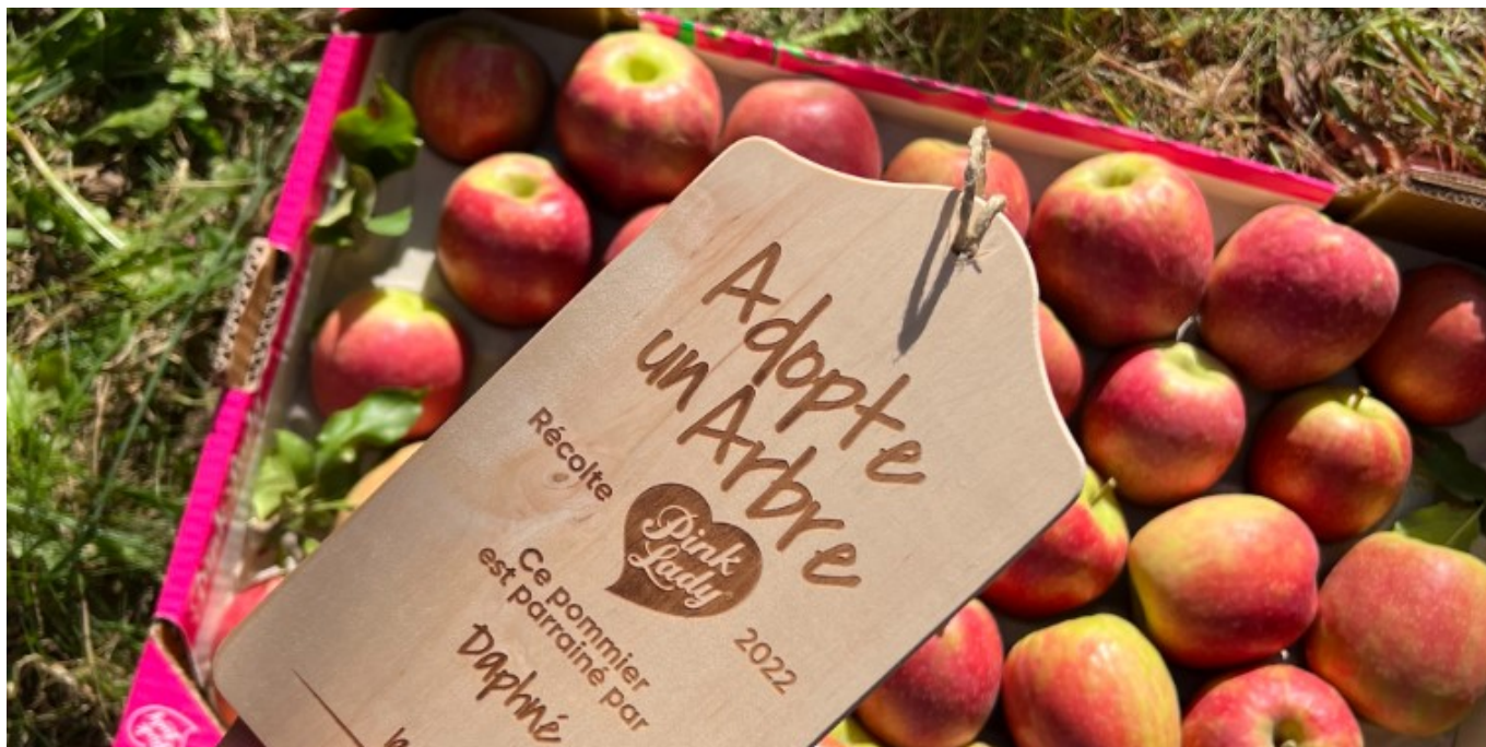
L'Opération adopte un arbre

Pink Lady Europe a supprimé le plastique au profit d'emballages en carton et de barquettes et travaille sur des stickers et étiquettes compostables.