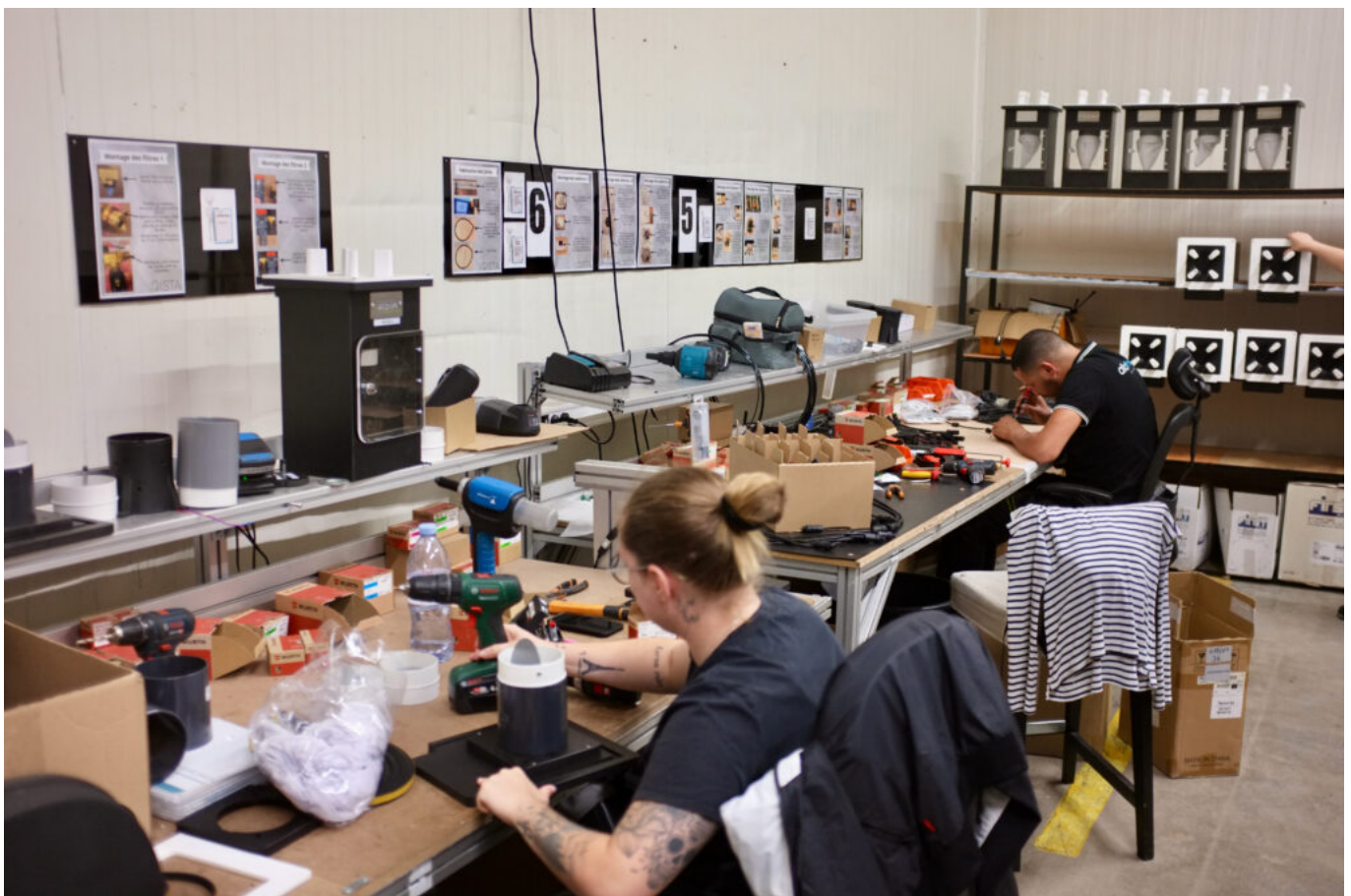
l'atelier d'assemblage