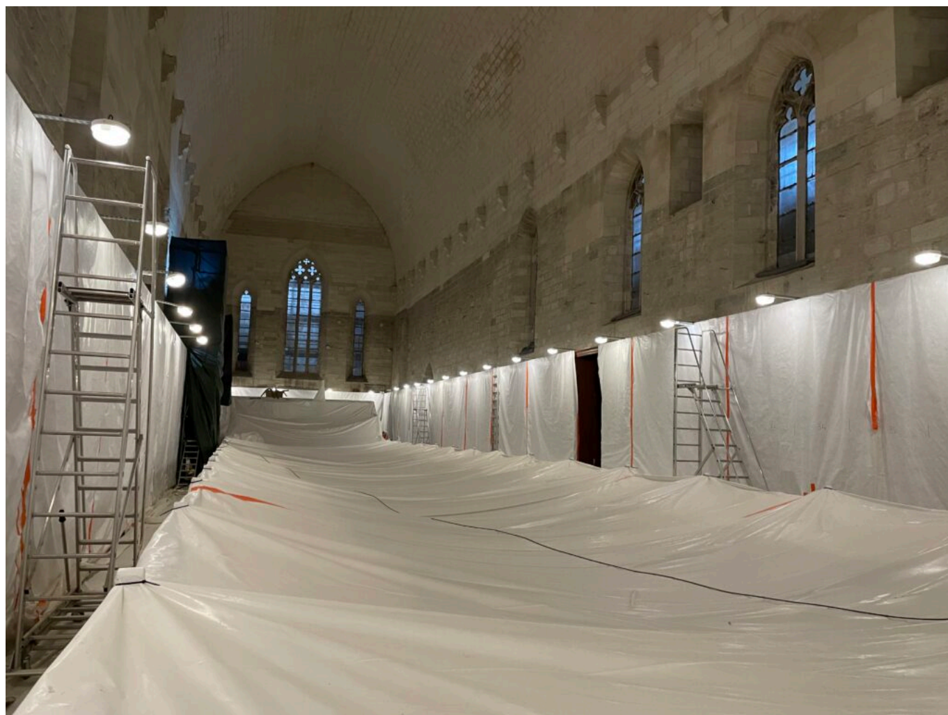
La Chapelle Benoit XII entièrement bâchée