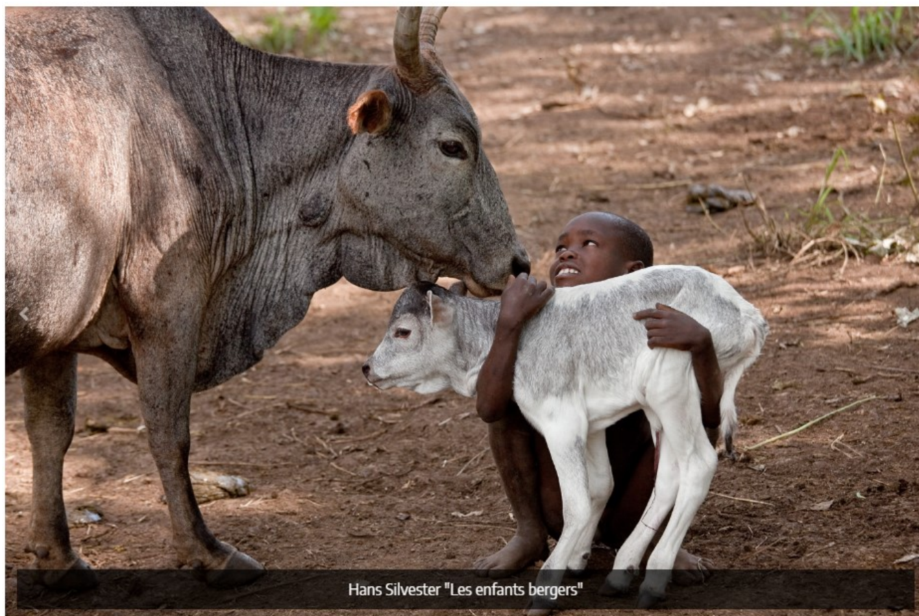
Les enfants berger, Hans Silvester, DR

La galerie d'art et la boutique Retour De Voyage sont ouvertes du mercredi au samedi de 10h30 à 13h et de 15h30 à 19h le dimanche de 9h30 à 13h30 et de 14h à 17h Et sur rendez-vous au 06 87 32 58 58. Retour de voyage, la maison sur la Sorgue , Place Rose Goudard à l'isle-sur-la-Sorgue. contact@lamaisonsurlasorgue.com ; www.lamaisonsurlasorgue.com ; www.retourdevoyage.com