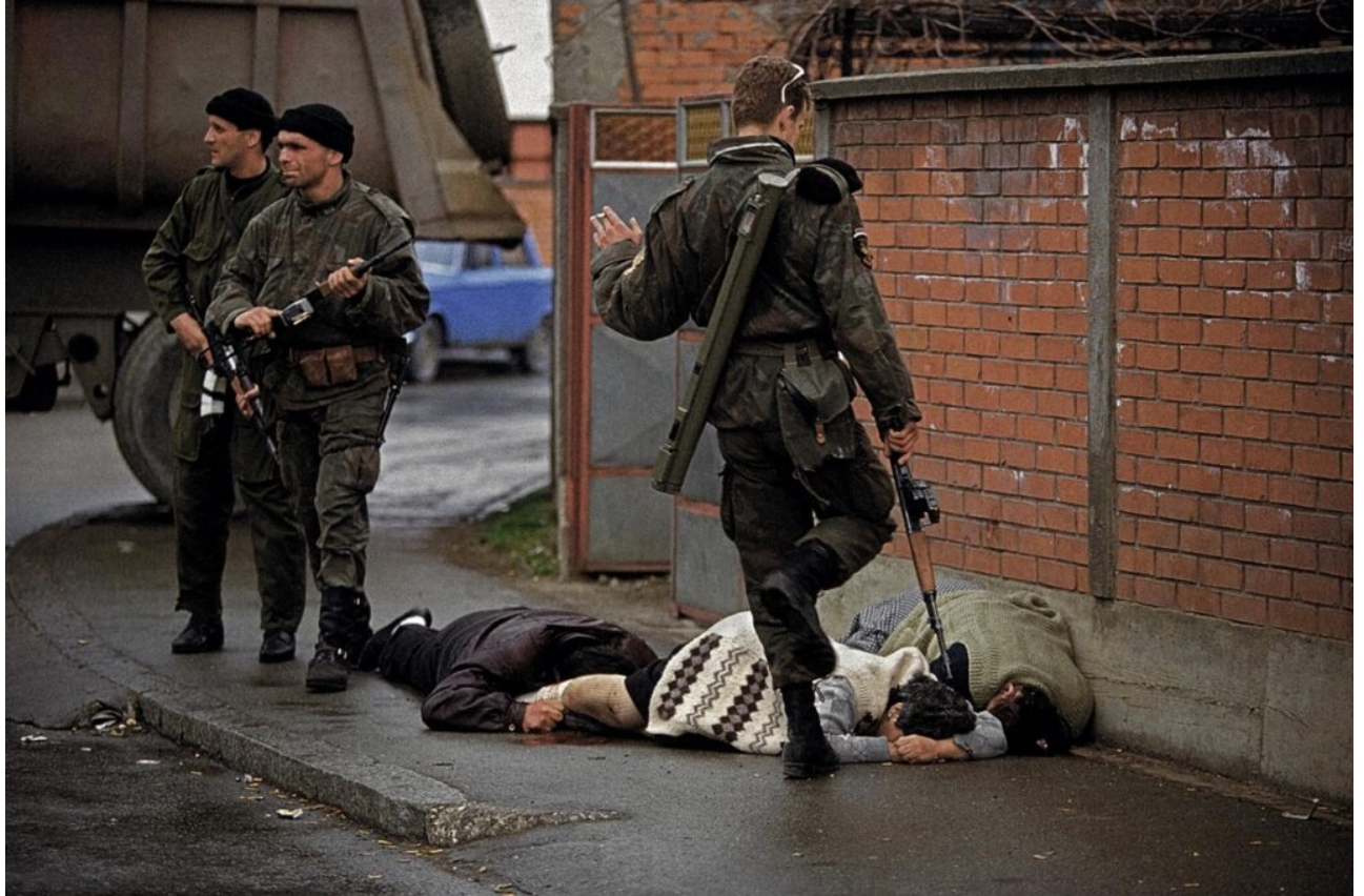
(Bosnie, avril 1992)