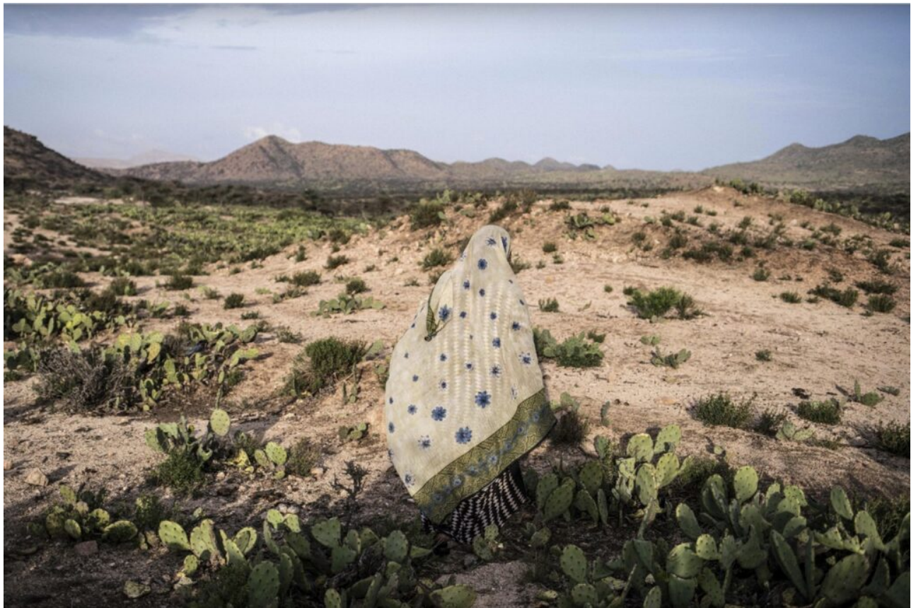
© Nichole Sobecki (Somaliland, avril 2016)