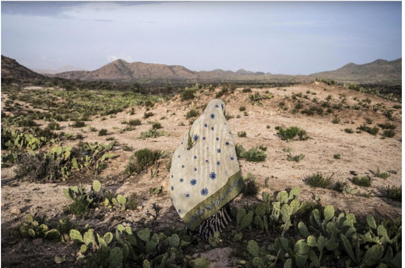
(Somaliland, avril 2016)