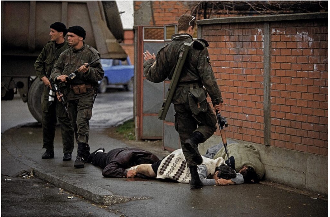
(Bosnie, avril 1992)