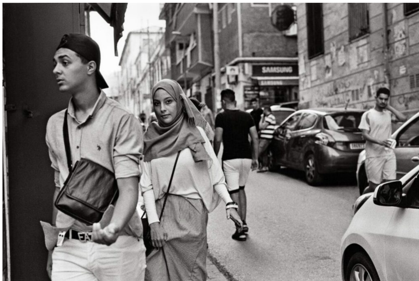
Alger, 2019

En 2019, alors qu'il souhaite pour la première fois publier ces photographies de 1961, Raymond Depardon réalise un nouveau voyage à Alger. « Nous sommes venus dire bonjour aux gens comme des touristes. La langue française est d'ailleurs un lien entre nos deux territoires », se souvient-il. Après Alger, il se rend à Oran pour y retrouver l'écrivain Kamel Daoud. De là, naît l'idée d'un livre et d'une exposition réunissant les photos des deux voyages de Depardon et les textes de l'auteur algérien. « Il y a beaucoup de jeunesse et d'espoir à Alger », assure le photographe, exposant même une dernière idée : « J'aimerais beaucoup que ces photos soient exposées aussi en Algérie, c'est leur Histoire aussi, j'aimerais leur en faire don. »