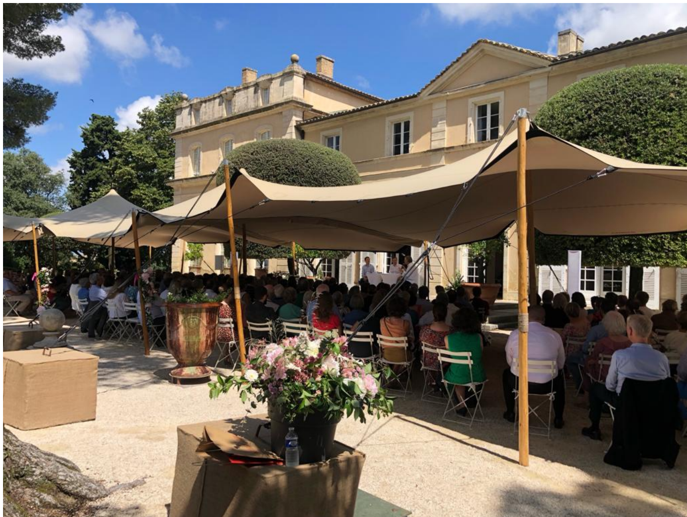
Le magnifique cadre du Château de la Nerthe