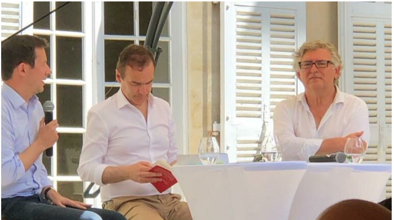
François-Xavier Bellamy, Franck Ferrand et Michel Onfray

Michel Onfray ajoute : « Le temps modifie l'enfant qui devient adulte, comme la graine qui devient plante. Au départ vous avez cette graine, elle explose et donne naissance à la tige qui grimpe, arrivent la feuille puis le bourgeon qui disparaît pour que naisse la fleur. L'enfant d'hier avec son idéal et ses blessures se dépasse lui-même, se détruit et devient l'adulte d'aujourd'hui ». Interrogé sur l'accélération du temps par Franck Ferrand, il précise : « Nous passons du liquide amniotique dans le ventre de notre maman à la vraie vie, de 4 pattes à bipède, nous avons un langage, bref, nous évoluons. Mais le futur n'est pas forcément mieux que le passé. »