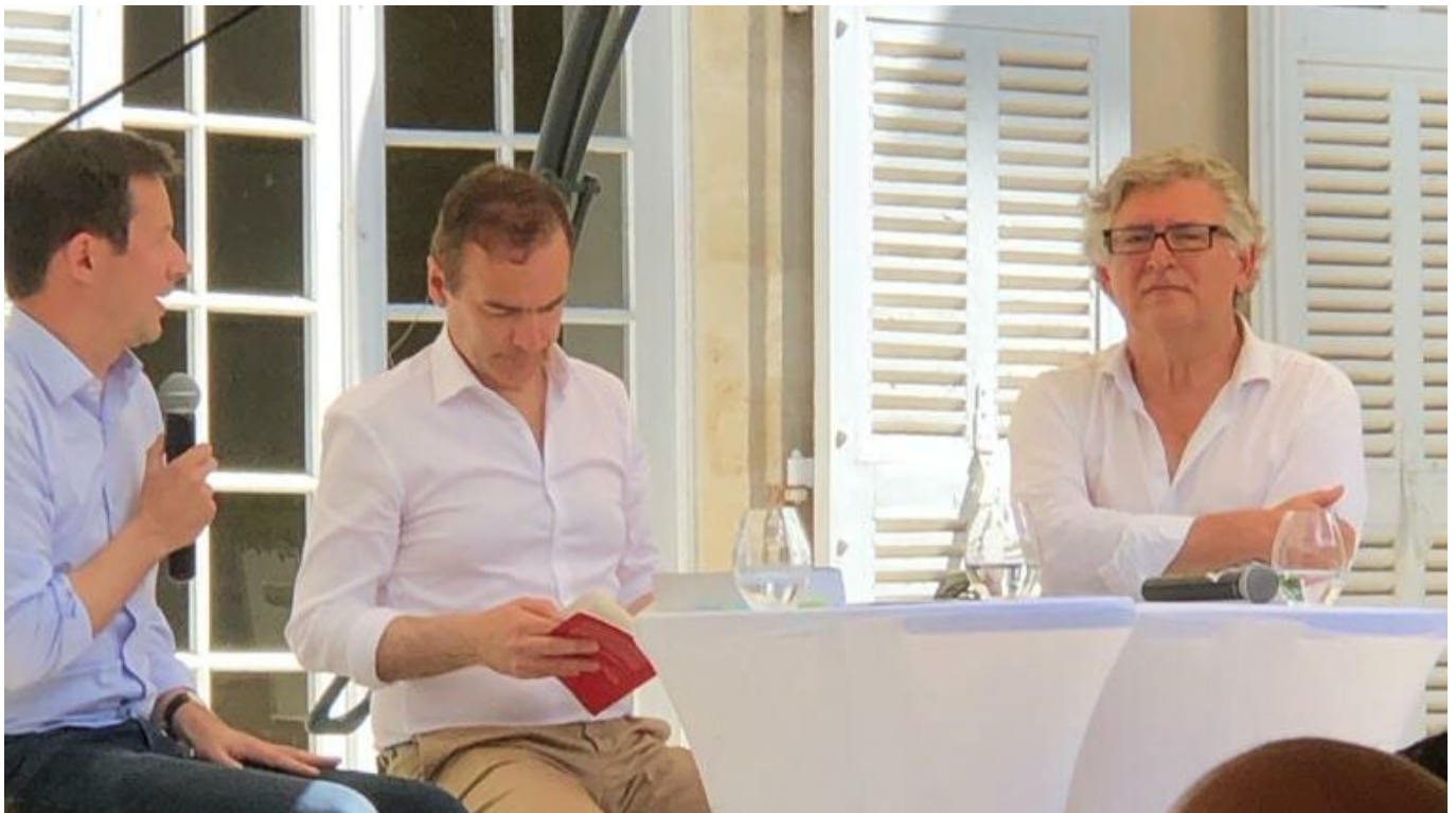
François-Xavier Bellamy, Franck Ferrand et Michel Onfray

Michel Onfray ajoute : « Le temps modifie l'enfant qui devient adulte, comme la graine qui devient plante. Au départ vous avez cette graine, elle explose et donne naissance à la tige qui grimpe, arrivent la feuille puis le bourgeon qui disparaît pour que naisse la fleur. L'enfant d'hier avec son idéal et ses blessures se dépasse lui-même, se détruit et devient l'adulte d'aujourd'hui ». Interrogé sur l'accélération du temps par Franck Ferrand, il précise : « Nous passons du liquide amniotique dans le ventre de notre maman à la vraie vie, de 4 pattes à bipède, nous avons un langage, bref, nous évoluons. Mais le futur n'est pas forcément mieux que le passé. »