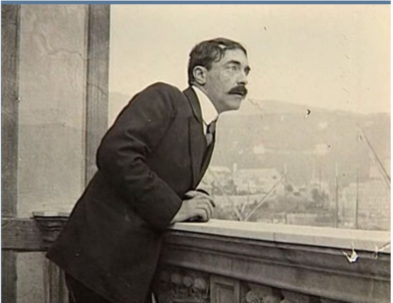
Paul Valéry