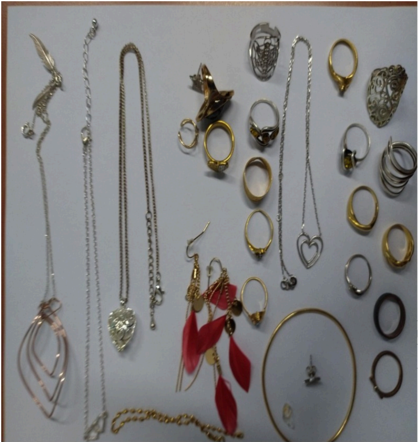
Objets trouvés