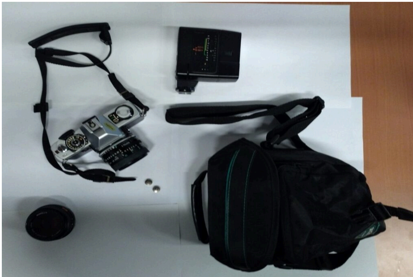
Objets trouvés