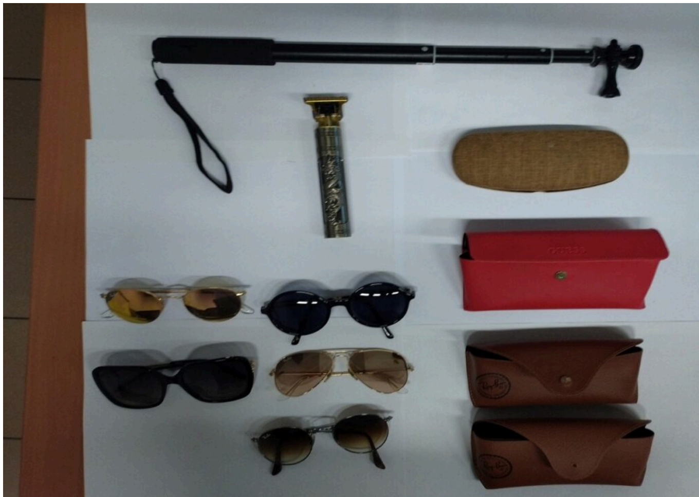
Objets trouvés