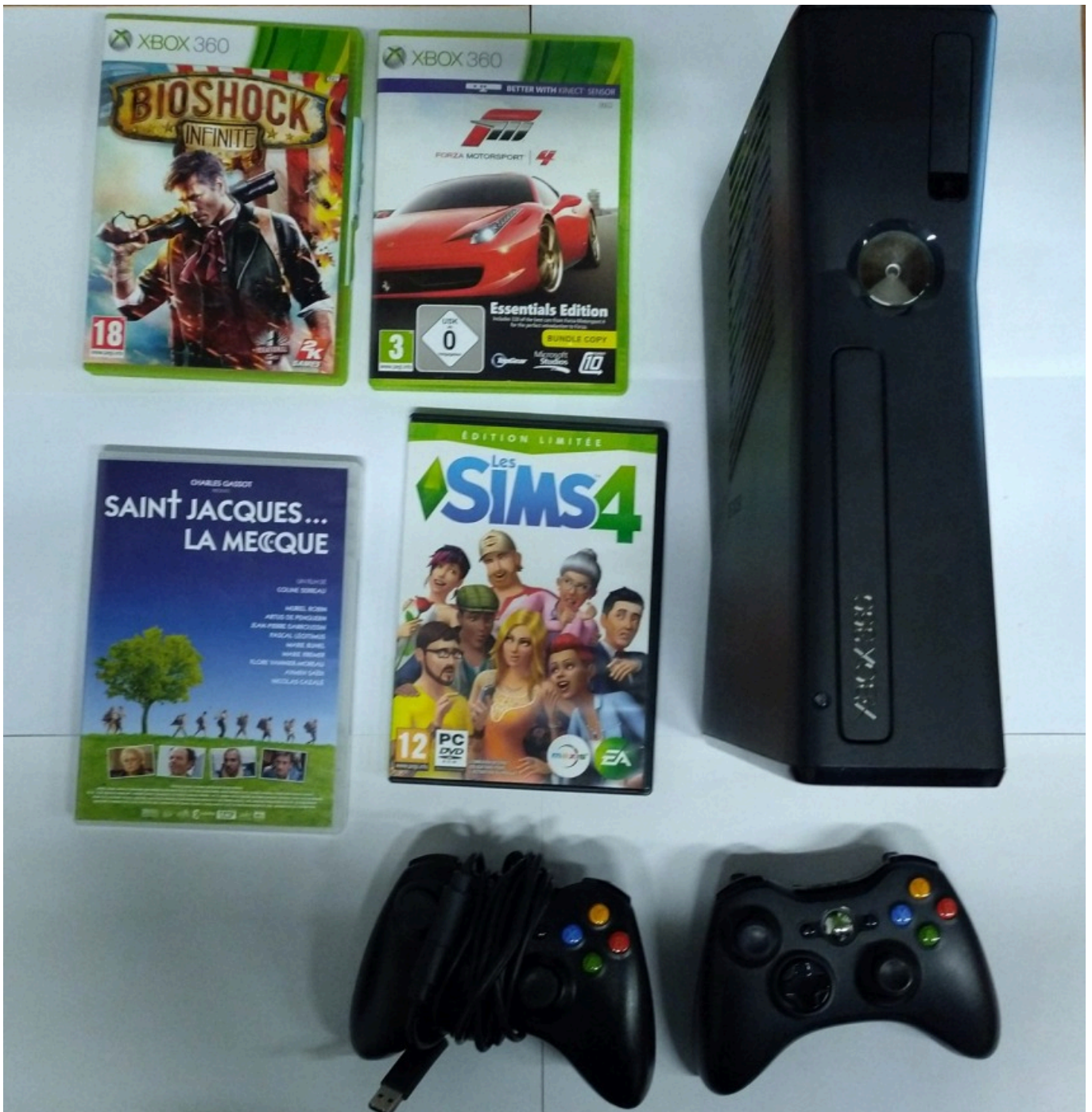
Objets trouvés