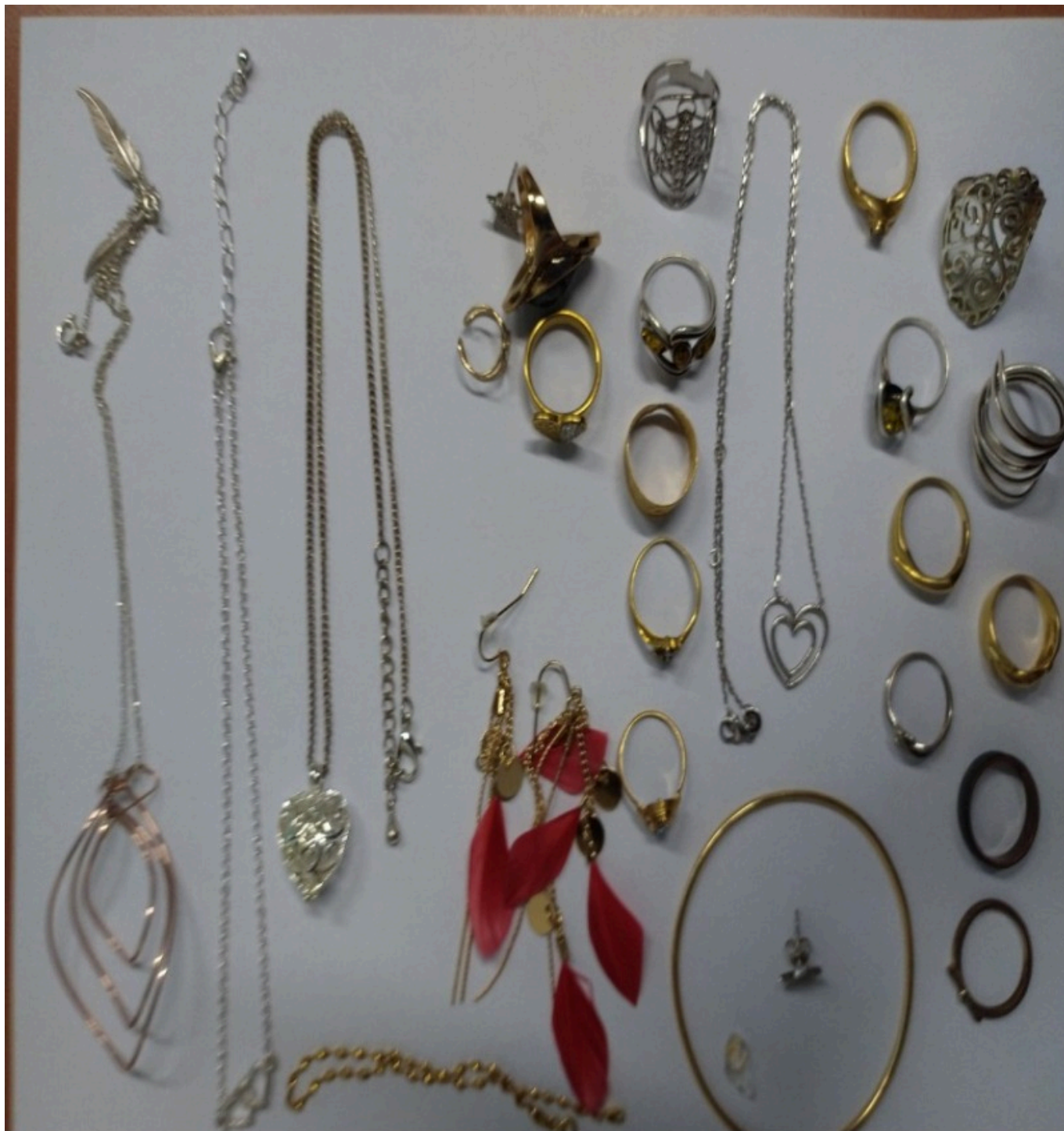
Objets trouvés