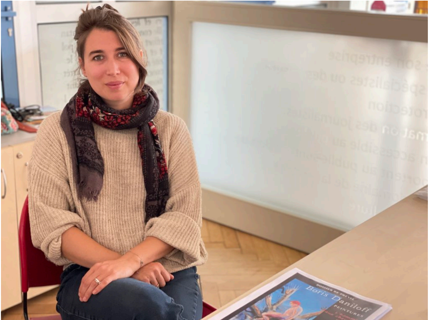
La réalisatrice Avignonnaise Florine Clap