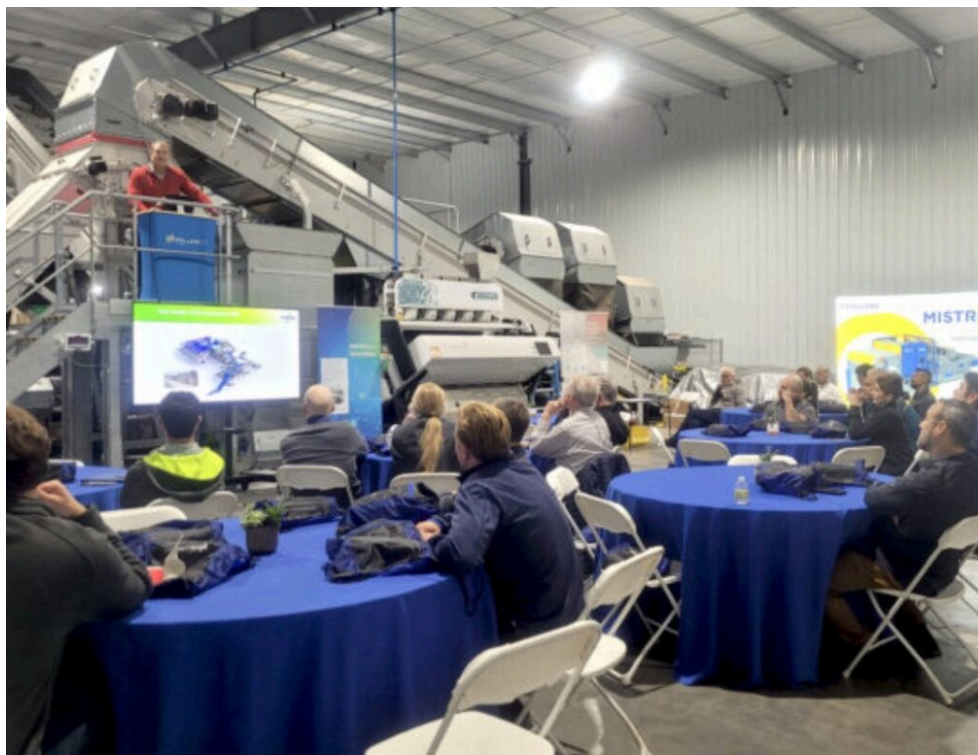
L'inauguration du nouveau centre de tests.