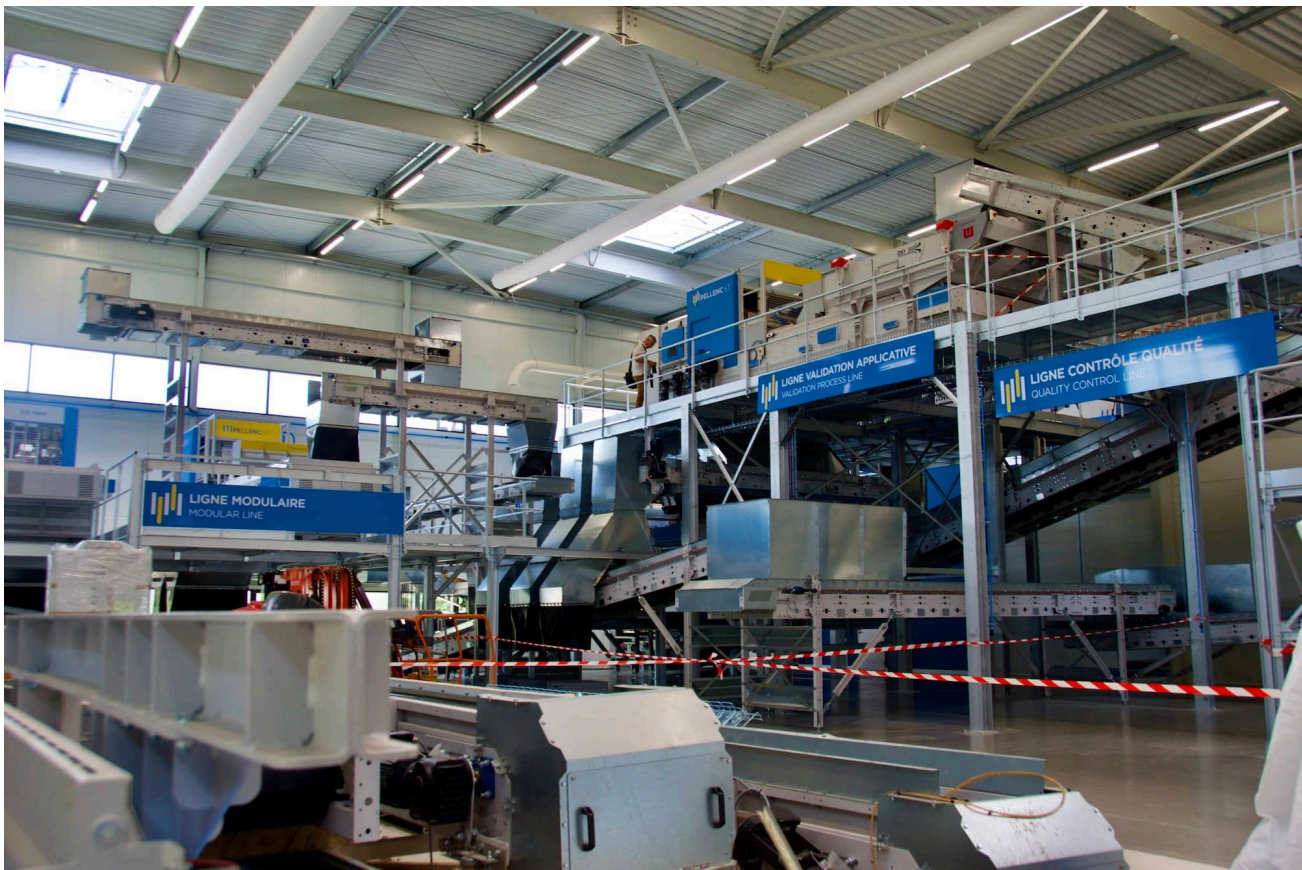
L'intérieur du Centre Innovation