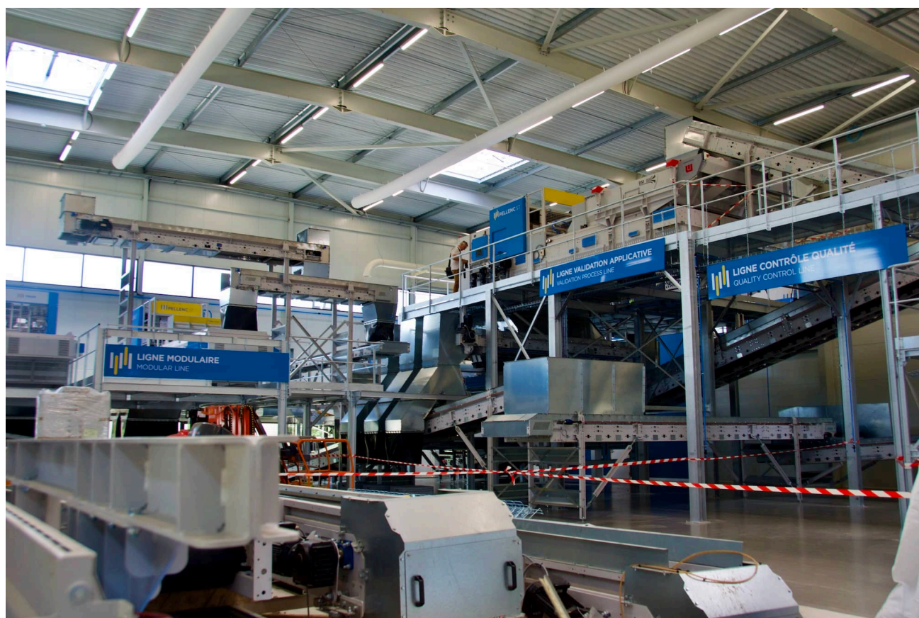
L'intérieur du Centre Innovation