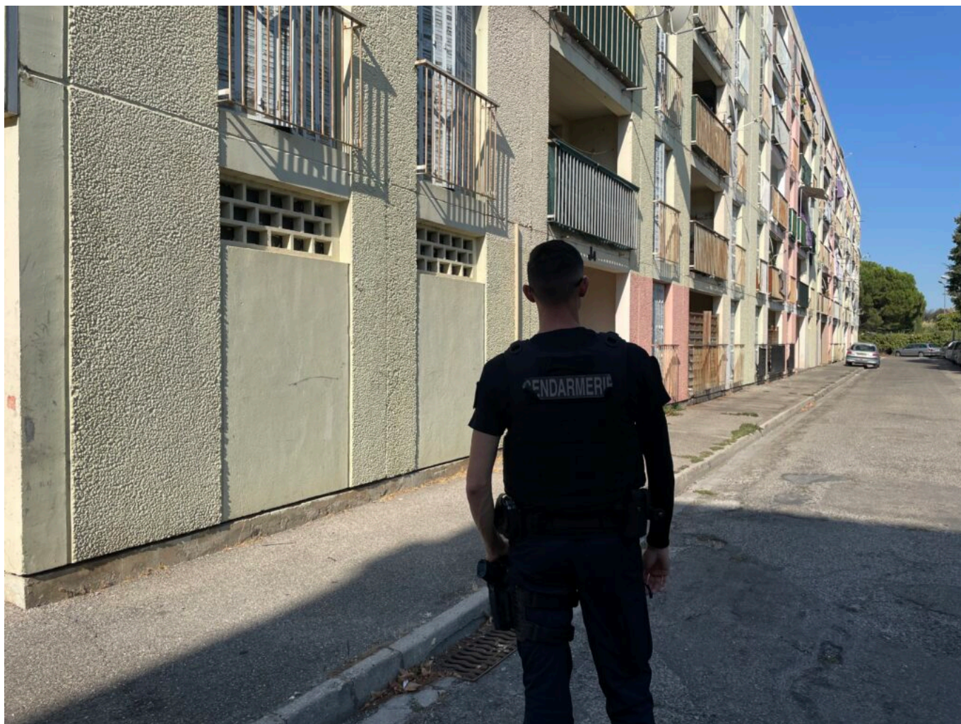
Cité l'Establet à Sorgues lors d'une opération conjointe Gendarmerie et Police municipale

Certains prénoms ont été changés par mesure de confidentialité.