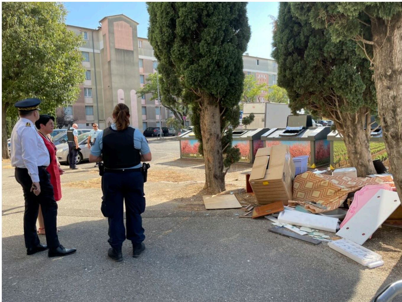
Cité l'Establet à Sorgues, patrimoine de Vallis Habitat