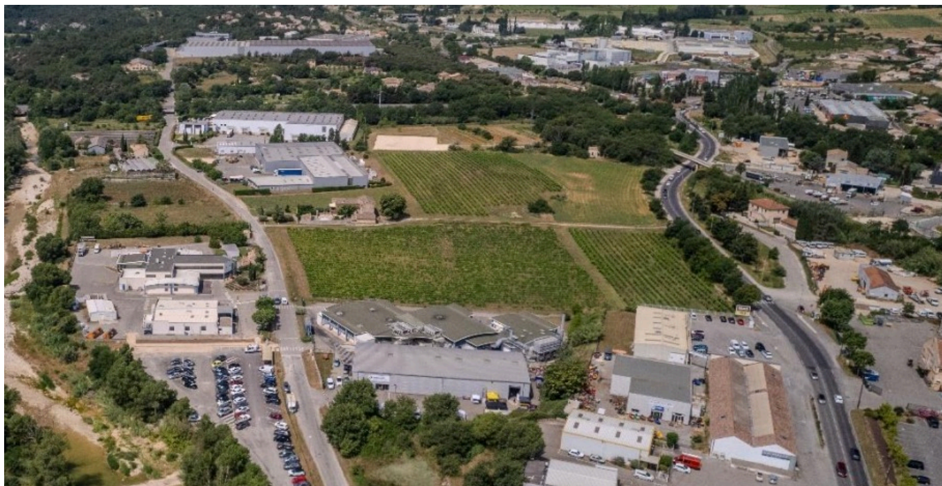
La zone industrielle Peyrolière.

Ces aménagements devraient permettre une montée en gamme de l'ensemble du Pôle d'activités Apt Ouest pour obtenir les niveaux supérieurs de qualité du label régional PARC+, le Pôle ayant atteint le niveau 1 du label pour la période 2022-2024. Le coût total des travaux s'élève à 275 517€, financés par la CCPAL, la Région Sud et le Département de Vaucluse.