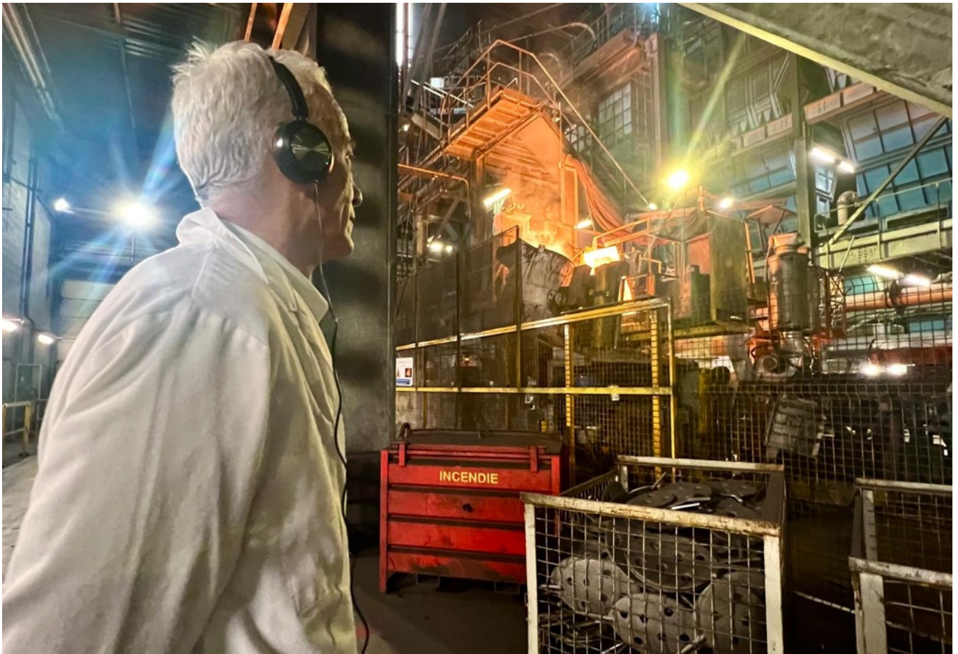
Le président du Medef en visite chez le C reuset.

« Compte-tenu de la confusion qui règne dans le paysage politique, beaucoup d'entre nous ont suspendu investissements et recrutement. »