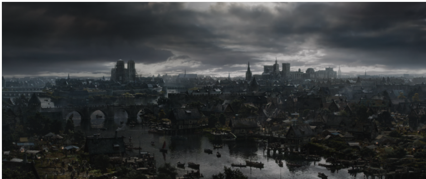
Paris au XIVE siècle selon Hollywood: à gauche, Notre-Dame de Paris, à droite, le palais des papes... d'Avignon.