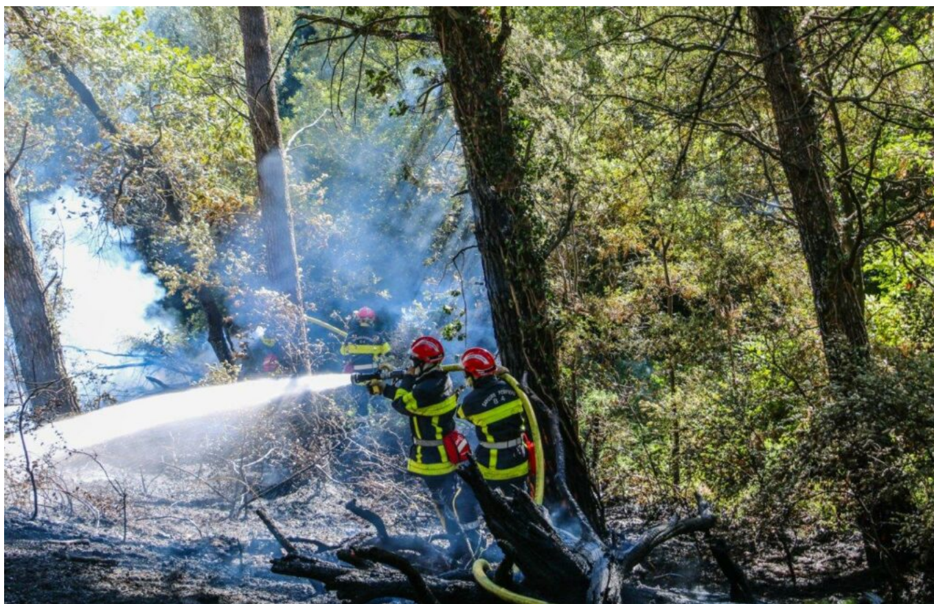
Feu de broussailles à Cairanne durant l'été 2020