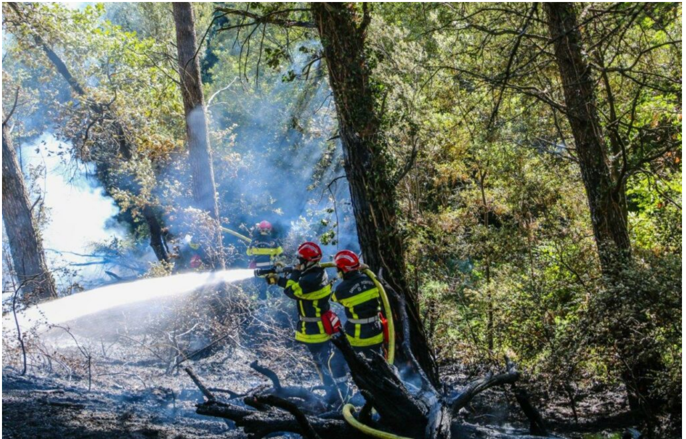
Feu de broussailles à Cairanne durant l'été 2020