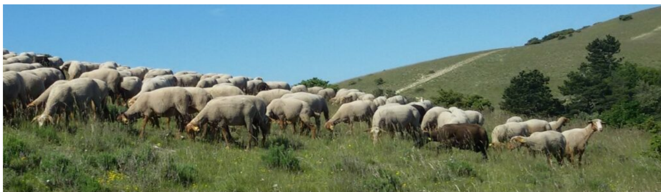
Troupeau de brebis

Lors de cette édition, 35 projets lauréats ont pu être mis en lumière et seront soutenus dans les prochaines années. Il s'agit d'une part de 24 nouveaux PAT émergents, voulus par des collectivités, et, d'autre part, de 11 autres projets visent à accompagner des PAT de manière collective, à l'échelle régionale ou infrarégionale, pour renforcer leur impact de manière coordonnée sur les territoires, en cohérence avec les dynamiques de réseaux existants.