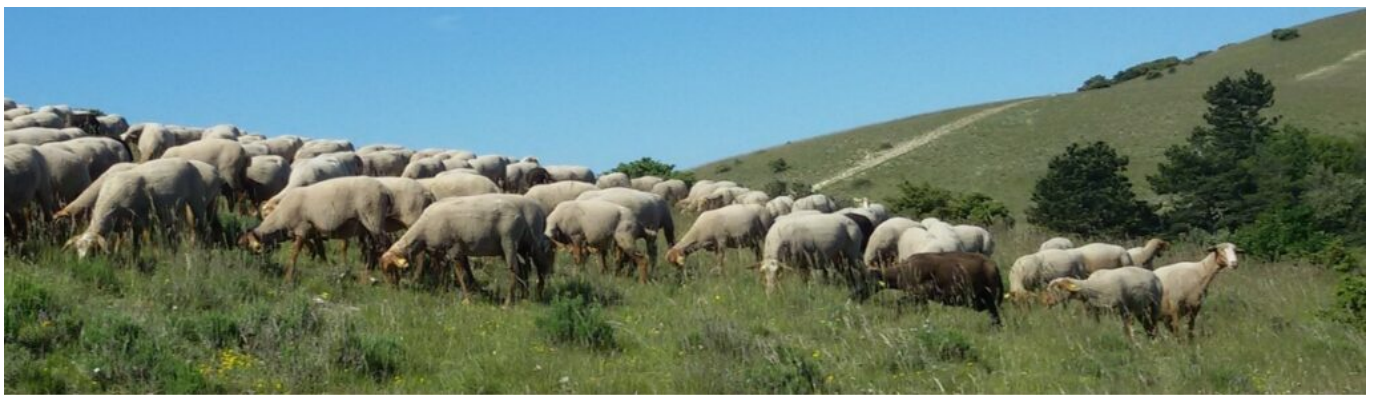
Troupeau de brebis

Lors de cette édition, 35 projets lauréats ont pu être mis en lumière et seront soutenus dans les prochaines années. Il s'agit d'une part de 24 nouveaux PAT émergents, voulus par des collectivités, et, d'autre part, de 11 autres projets visent à accompagner des PAT de manière collective, à l'échelle régionale ou infrarégionale, pour renforcer leur impact de manière coordonnée sur les territoires, en cohérence avec les dynamiques de réseaux existants.