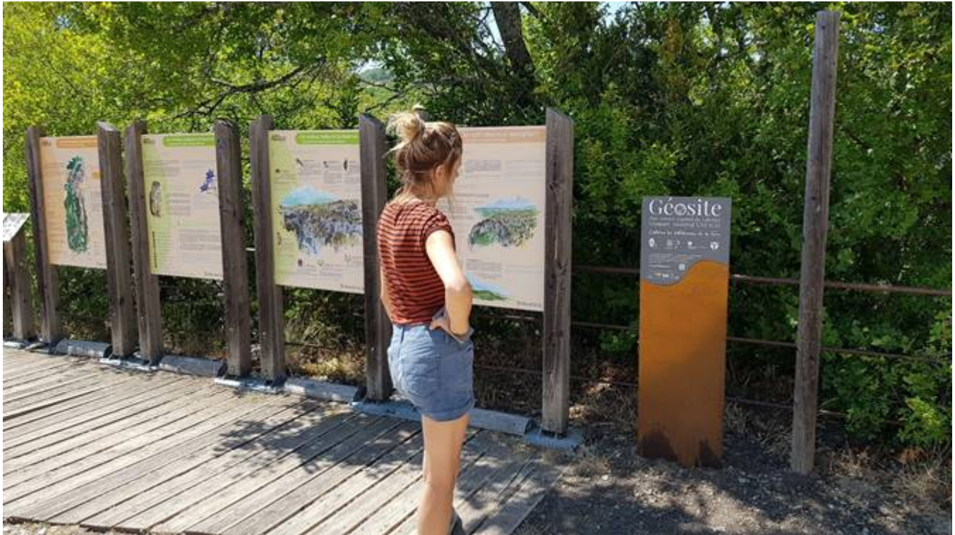
Les gorges d'Oppedette, géosite du Luberon