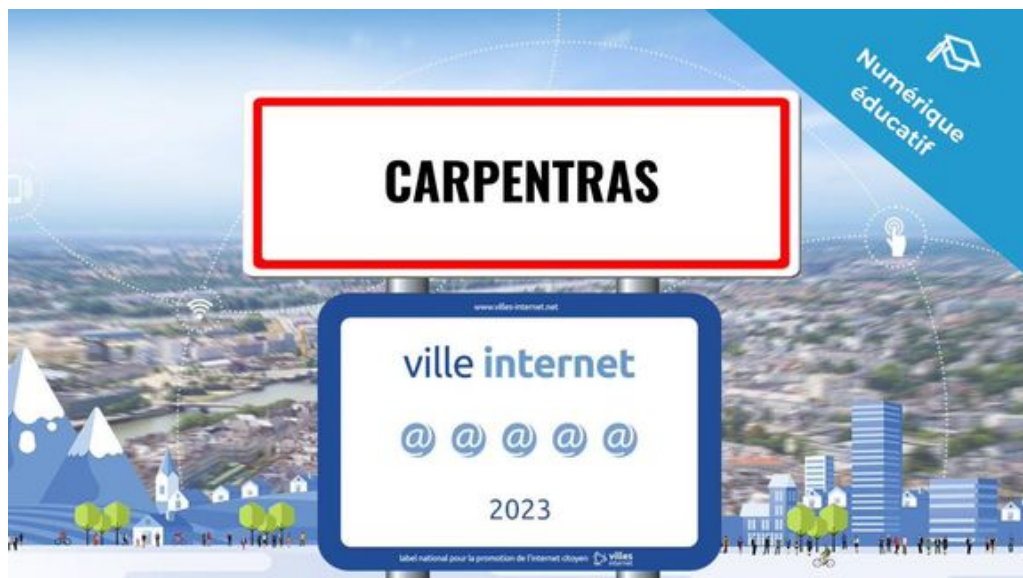
Figure de proue de cette excellence numérique départementale, avec ses 5 @@@@@ Carpentras décroche le niveau le plus élevé de ce label récompensant chaque année les collectivités qui œuvrent

Carpentras, Courthézon et Monteux figurent parmi les 257 collectivités françaises à apparaître dans le palmarès 2023 des ' Territoires, villes et villages internet ' qui vient d'être dévoilé lors d'une cérémonie de remise de prix qui s'est tenue à Albi. Placée sous le haut patronage du président de la République, cette distinction est remise depuis 1998 par l'association ' Villes internet ' qui s'est donnée pour mission d'accompagner le déploiement des politiques publiques numériques locales.