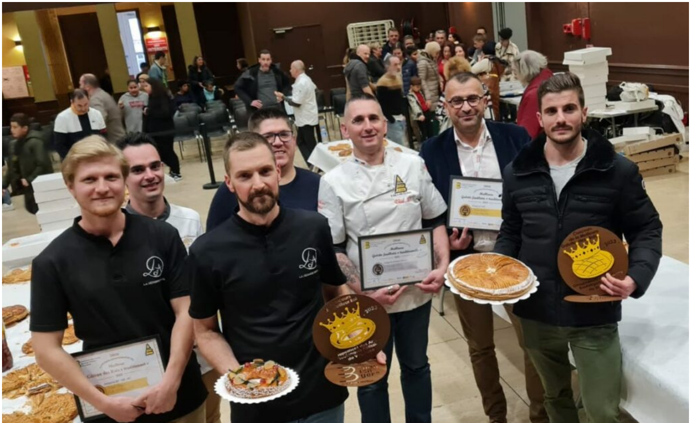
Une partie des lauréats du concours.