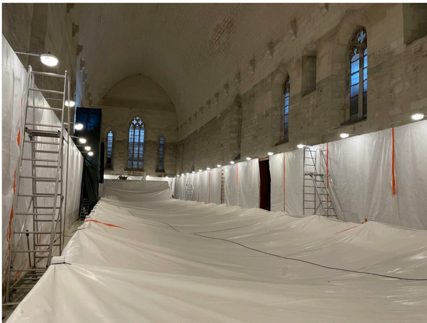
La Chapelle Benoit XII entièrement bâchée