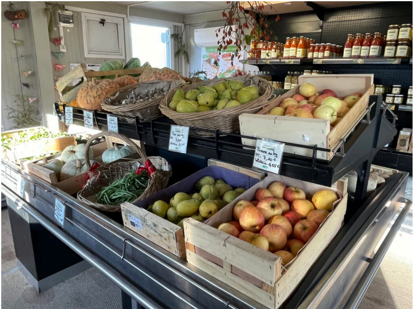
La boutique Semailles