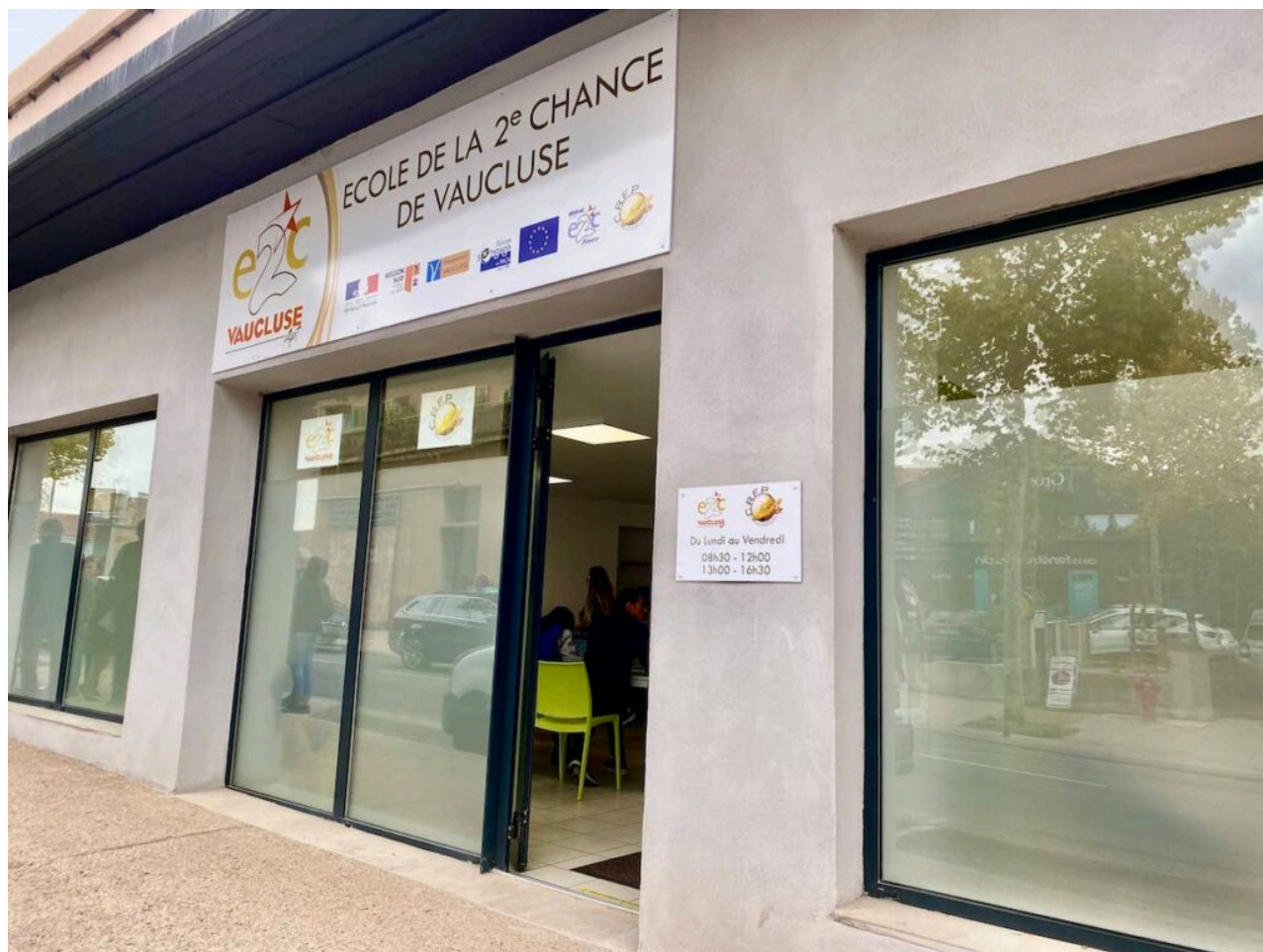
L'antenne aptésienne.