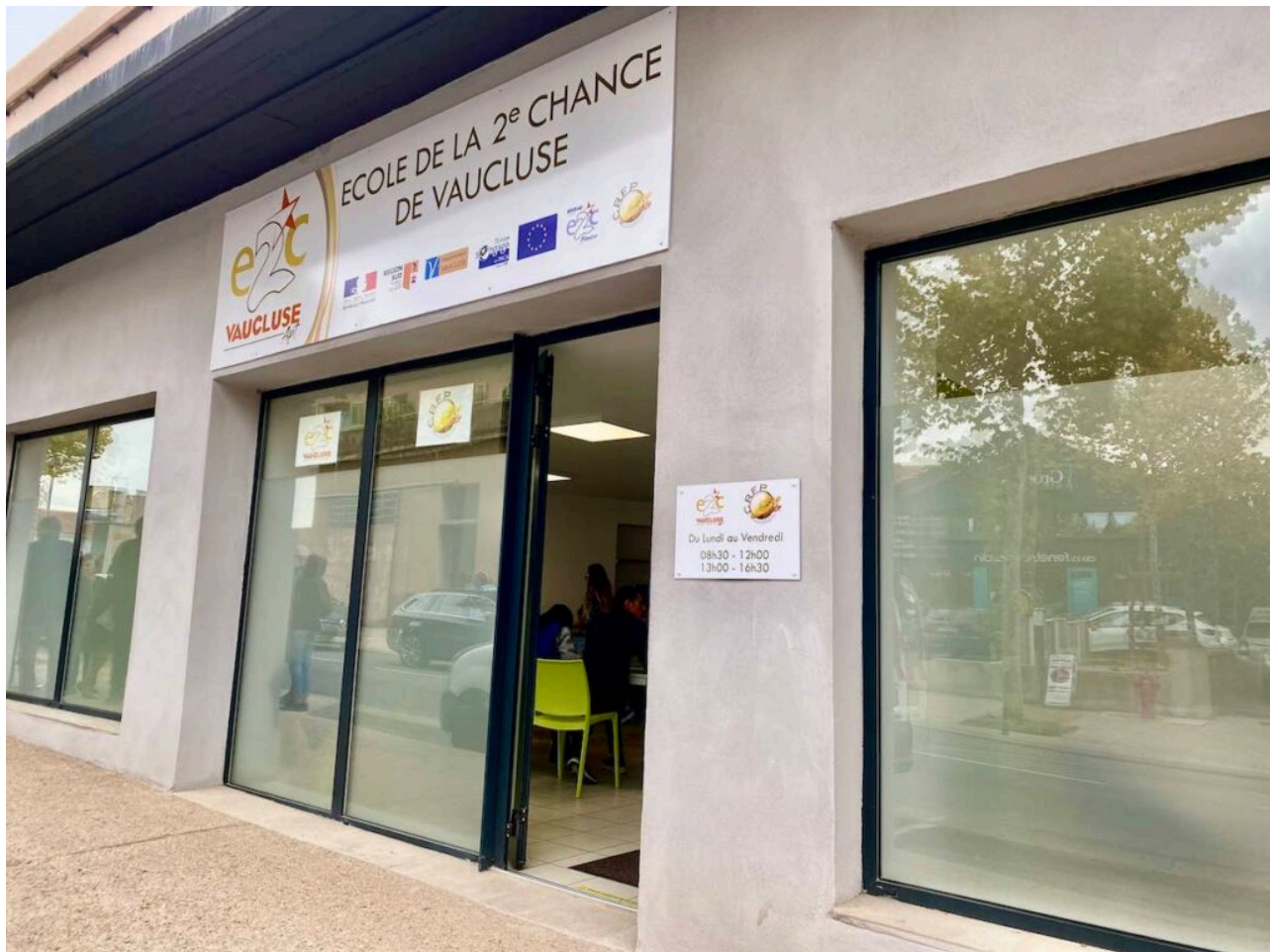
L'antenne aptésienne.