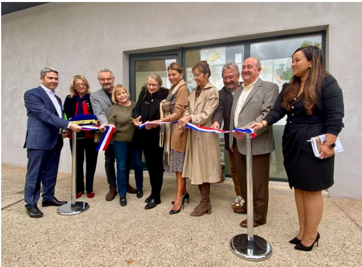
Les élus et responsables de l'école de la 2 e chance inaugurent l'antenne d'Apt.

Une fois la porte d'entrée passée, la première salle a tout d'une salle de classe traditionnelle, ou presque. Une dizaine d'ordinateurs sont à disposition. Au centre de la pièce, les bureaux des stagiaires, disposés à la manière d'une salle de réunion, pour que tous puissent se faire face. Derrière eux, un tableau blanc. Ils ont tous entre 16 et 25 ans, mais ne suivent pas des cours classiques. Chaque semaine, ils réalisent des projets et des activités pédagogiques, participent à des activités culturelles, citoyennes, d'entreprise ou de mobilité.