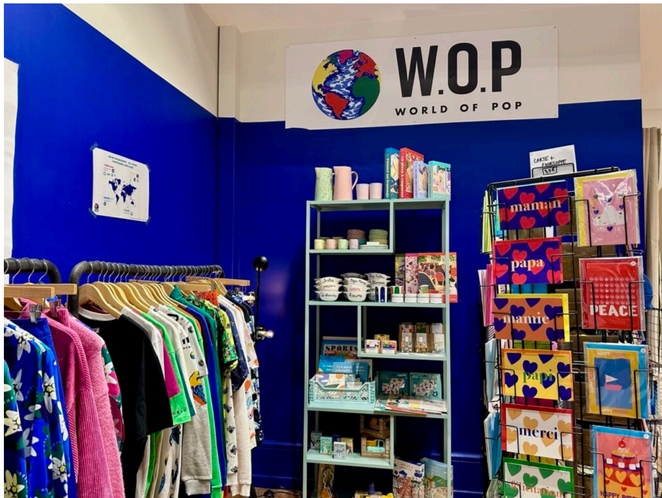
Un coin du pop-up store avignonnais.

des puzzles, de la papeterie, et bien d'autres surprises.