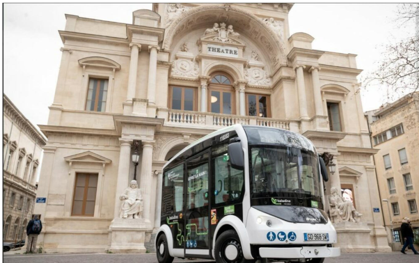
La baladine est gratuite depuis Juillet