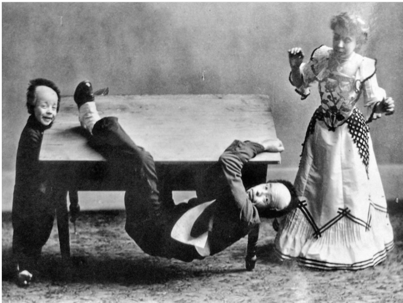
Buster Keaton enfant avec ses parents