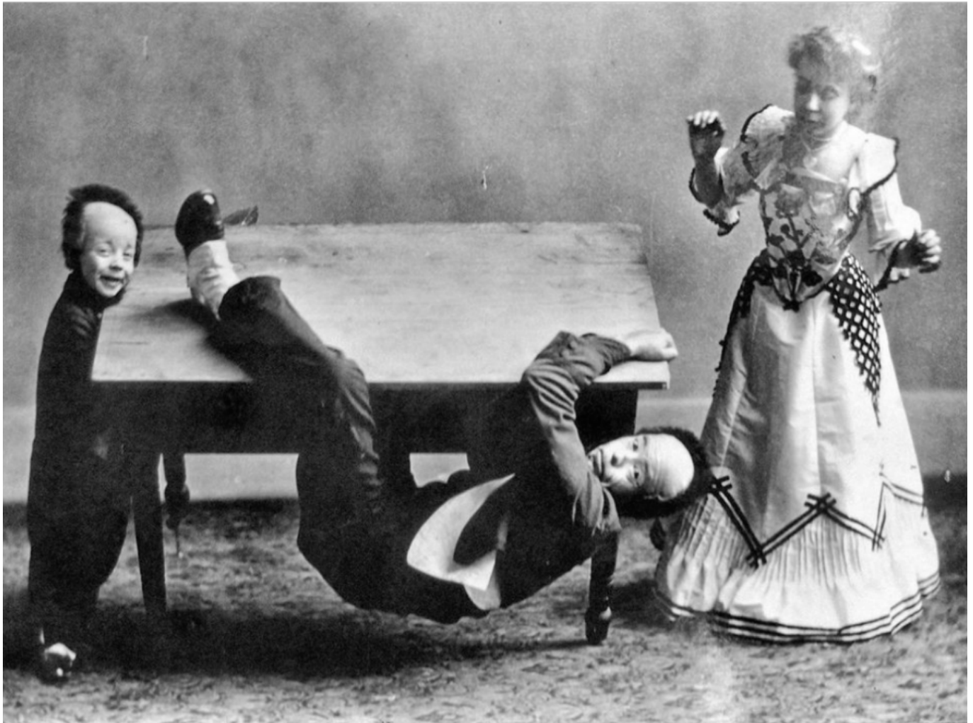
Buster Keaton enfant avec ses parents