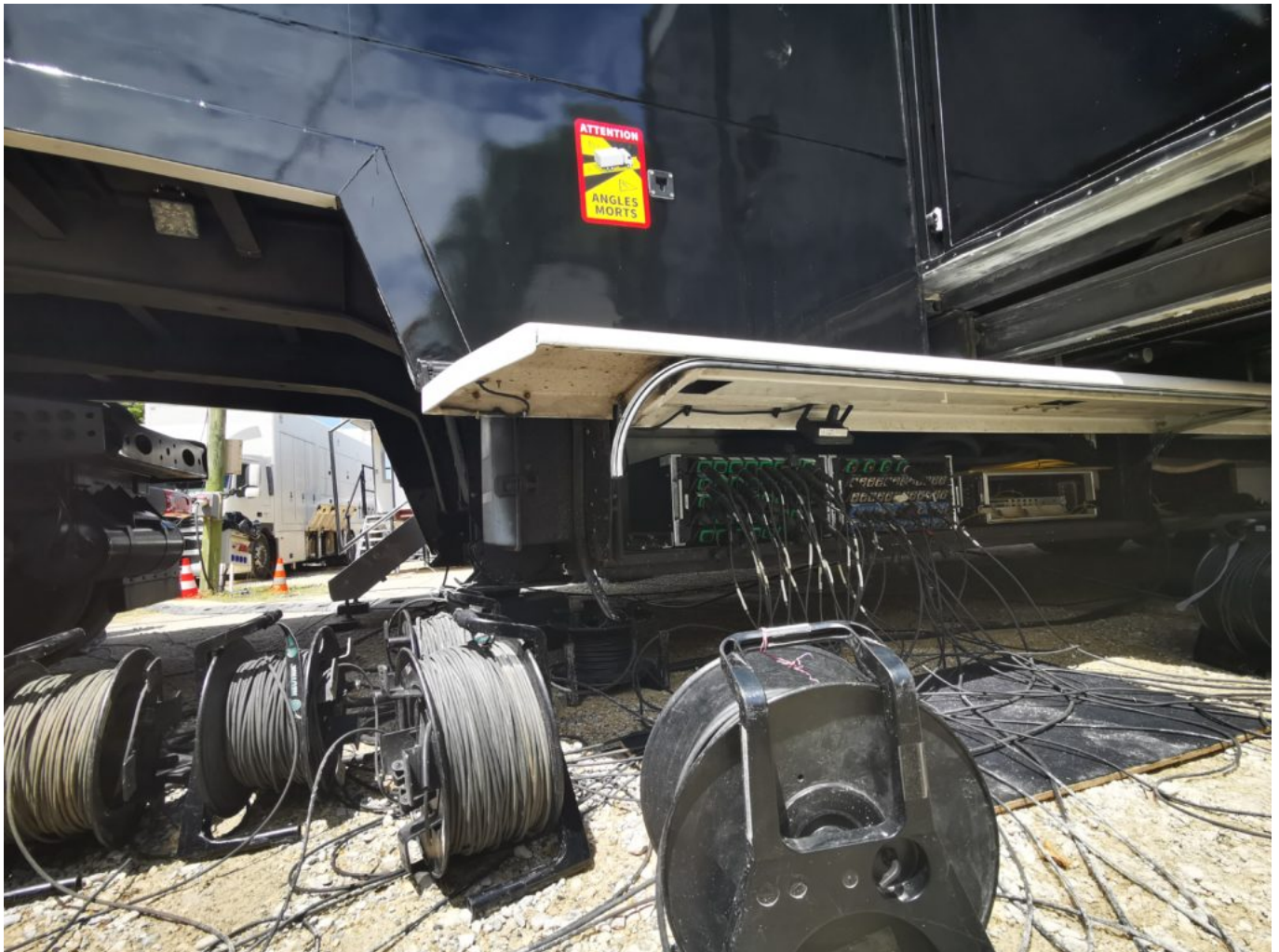
Attention aux fils !

Vient ensuite la diffusion de la course à assurer. Les images et sons des médias sont acheminés par un faisceau hertzien (FH). Les caméramans en moto envoient les images et le son vers un hélicoptère qui lui-même renvoie le signal vers des avions à plus haute altitude, signal récupéré ensuite par un récepteur placé en haut d'une grue jaune sur la ligne d'arrivée. Les équipes sont aussi chargées de retransmettre l'arrivée de l'étape, les visioconférences et les interviews des coureurs.