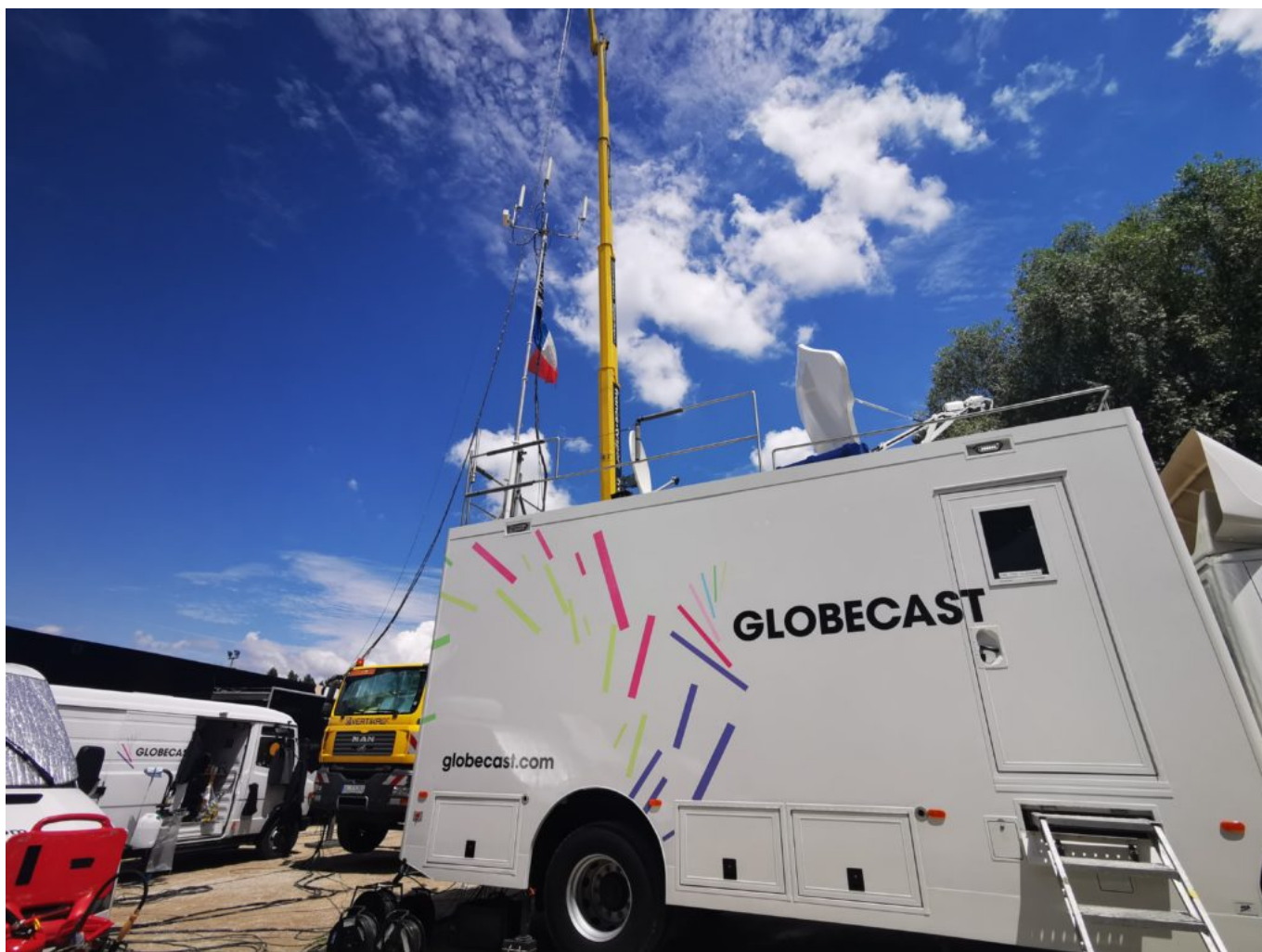
Globecast, filiale d'Orange.

En sortant du car, nous voilà nez à nez avec une étrange girafe jaune perdue dans le ciel bleu. Une grue qui porte des paraboles à 60 mètres de haut. Elles servent de relais entre le car de la SFP, qui récupère les flux vidéo des motos et des hélicoptères, et le car régie de France Télévisions dans lequel le réalisateur sélectionne les images qui passent à l'antenne.