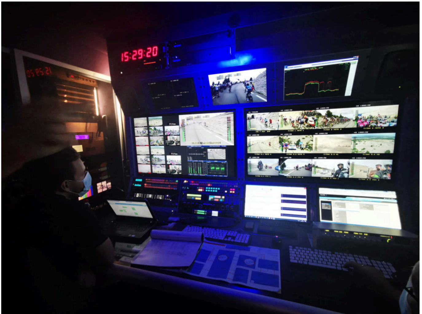
Les faisceaux lumineux jaillissent de toutes parts chez Globecast.

Ces dernières sont récupérées, traitées qualitativement et transmises au car de production de France Télévision. Ce dernier renvoie ensuite la réalisation à Globecast qui se charge de transmettre le produit fini par satellite, ce sont les images que vous voyez dans votre salon. Sur les multiples écrans, nous apercevons les captations des hélicoptères, les caméras privatives d'ASO et France Télévision, NBC, Eurosport et leurs commentateurs. La voix du réalisateur résonne depuis l'enceinte : « fais-moi un plan sur la moto 1, top ! Hélicoptère numéro 2 preview, prépare-toi ! »