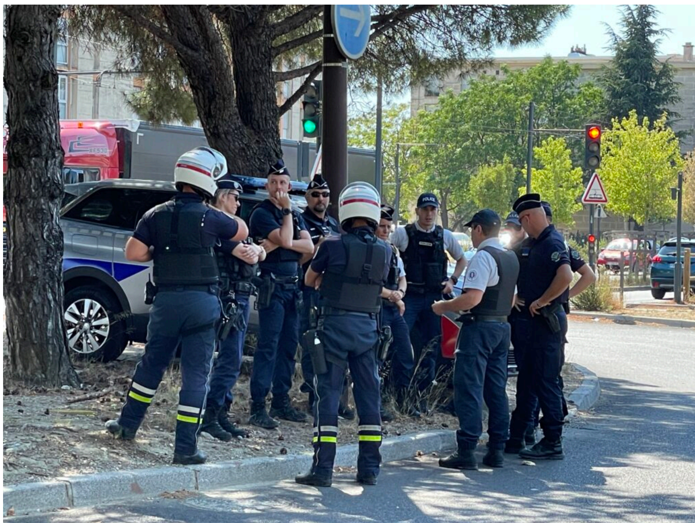
Le briefing pour la mise en place du dispositif