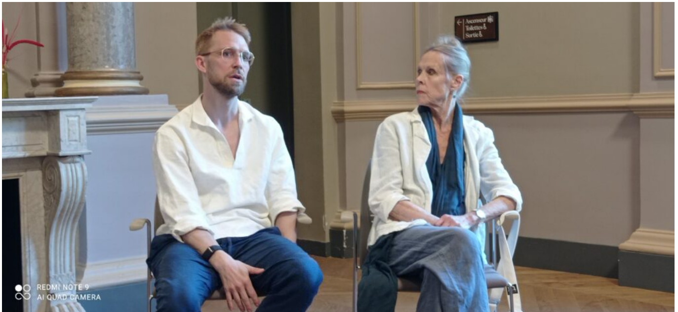
Pontus Lidberg et Carolyn Carlson.