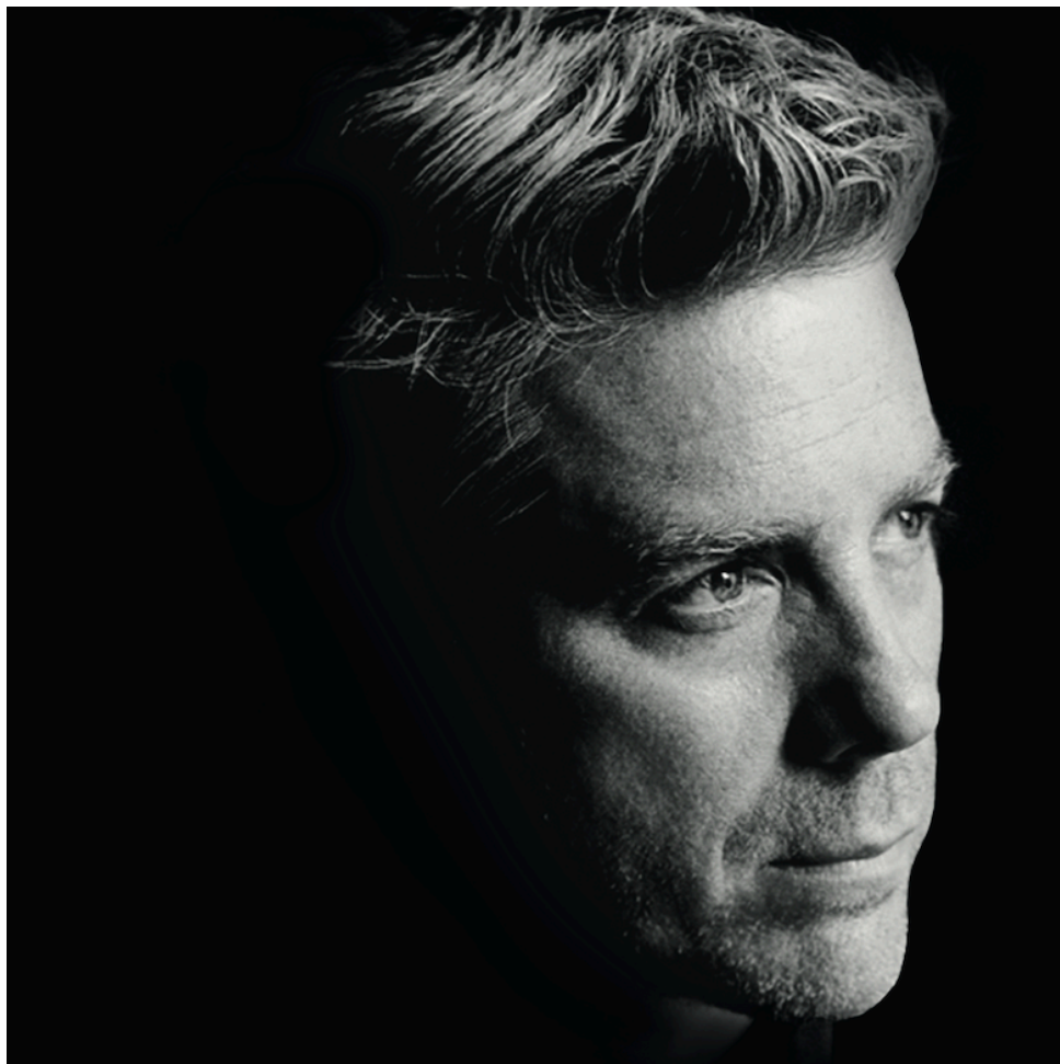
Kyle Eastwood.