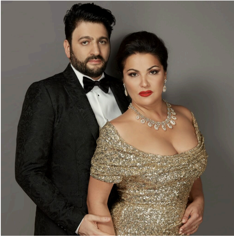
Anna Netrebko et son époux le ténor Yusif Eyvazov.

Enfin les Chorégies souhaitent accueillir des jeunes, c'est la raison pour laquelle, le directeur avec le conseil d'administration soutient des musiciens émergents, ce sera le cas le 13 juillet au Théâtre des Princes. « Allez les voir, les découvrir, ils sont formidables. En ce moment avec la crise tout court et la pandémie, les engagements sont rares, donnez-leur un coup de main ».