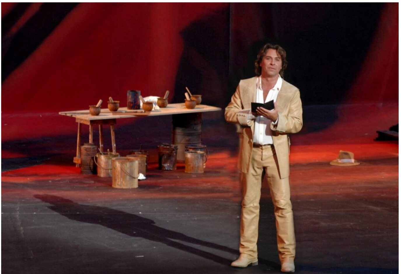
Roberto Alagna dans Tosca.

Que de tenors et baryton ont mis le feu aux gradins : Luciano Pavarotti, Plácido Domingo, José Carreras, Leo Nucci, José Van Dam, Ruggero Raimondi, Roberto Alagna, Rolando Villazon, Alain Fondary, Gabriel Bacquier, Vittorio Grigolo, Juan-Diego Flores, Giacomo Aragall, Jonas Kaufmann.