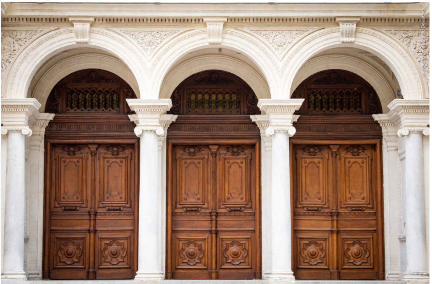
Détail de la porte de l'opéra-Théâtre d'Avignon

Contact, programme, billetterie : operagrandavignon.fr 04 90 14 26 40