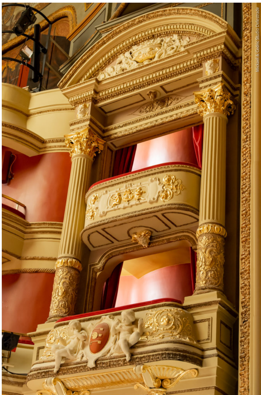
Détail des balcons de l'Opéra-Théâtre d'Avignon