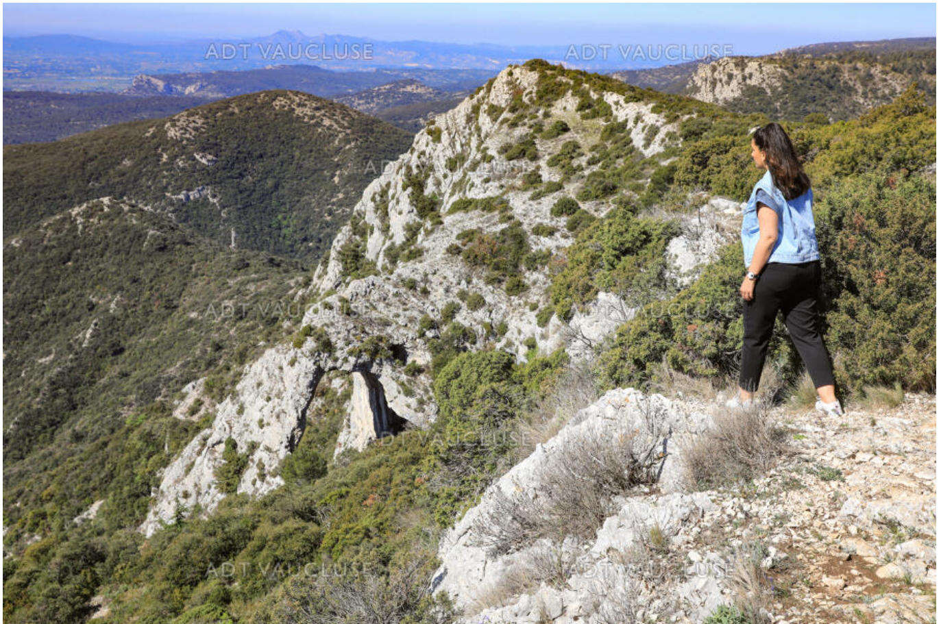
HOCQUEL A - VPA

Depuis le 15 juillet et jusqu'au 1 er septembre, l'Office français de la biodiversité (OFB), en collaboration avec la Gendarmerie, prévient et contrôle les éventuelles atteintes à l'eau et à la nature dans les espaces naturels du Vaucluse.