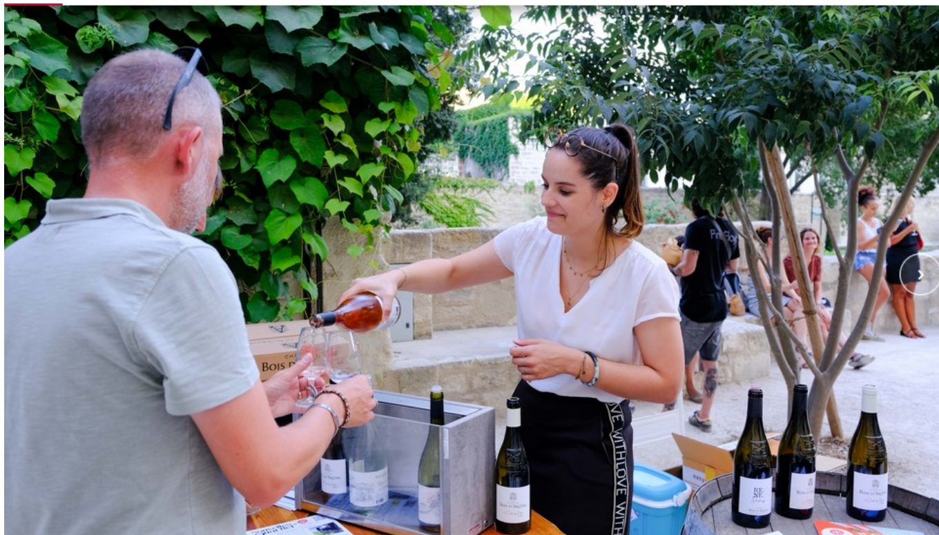
Un verre au jardin