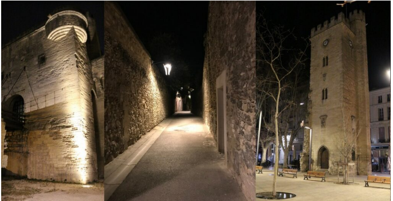
DR Les noctambules