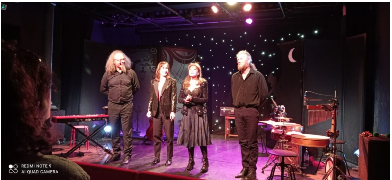
Mon petit cabaret.