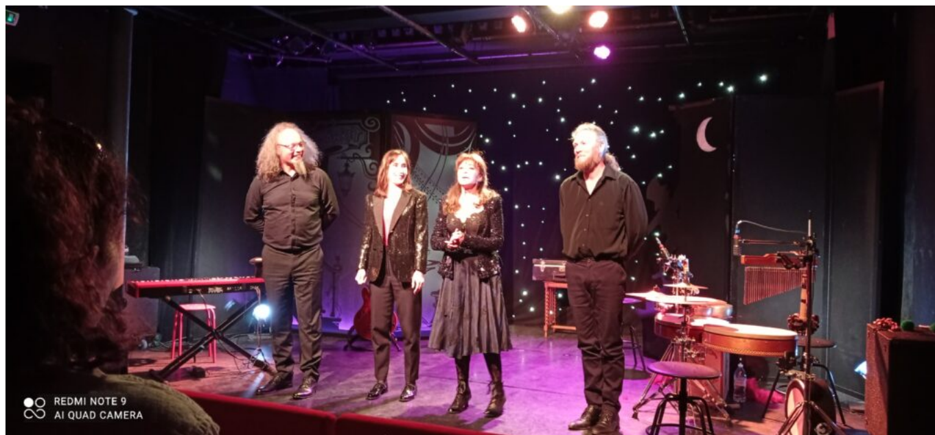
Mon petit cabaret.

Dans un tout autre genre « Aimer tue », un spectacle écrit par Myriam Grelard et formidablement interprété par François Cracovy, nous plonge dans les méandres judiciaires d'un féminicide. Dès le début nous connaissons les faits mais pas la sentence, qui nous appartiendra à nous, spectateurs de décider à la fin du spectacle. La force de ce texte est de nous tenir en haleine, malgré la tragédie et de nous bousculer dans nos jugements. Le théâtre du Chapeau Rouge devient un prétoire oppressant où amour, justice et folie se bousculent. Belle découverte. «Aimer tue » . Théâtre du Chapeau Rouge. Rue du Chapeau Rouge.17h20.