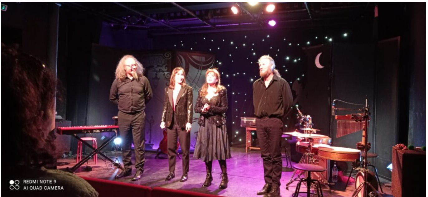
Mon petit cabaret.