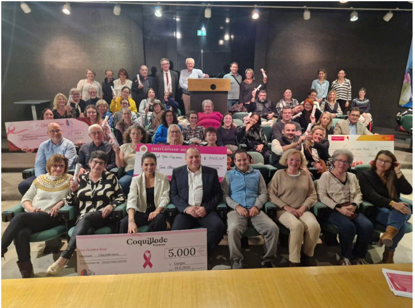
Remise des dons à l'Institut Sainte-Catherine Avignon