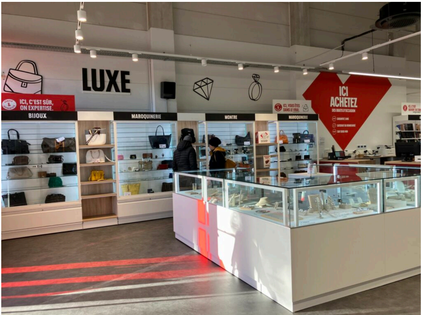
Le magasin d'Avignon.

Aujourd'hui estimé à 12 milliards d'euros en France, le marché de la seconde main a le vent en poupe et ne cesse de progresser. Pour preuve : au cours des derniers mois, 6 Français sur 10 ont acheté ou vendu des produits d'occasion, ou opté pour des produits reconditionnés. Le regard des consommateurs sur la seconde main a profondément changé depuis plusieurs années. Là encore, 6 Français sur 10 considèrent que l'occasion est d'aussi bonne qualité que le neuf (+14 points en un an). Easy Cash a d'ailleurs annoncé le lancement d'une garantie 2 ans sur l'ensemble de ses produits il y a quelques mois. Une durée, équivalente à celle du neuf, qui gomme un peu plus les frontières existantes entre les offres de première et de seconde main.