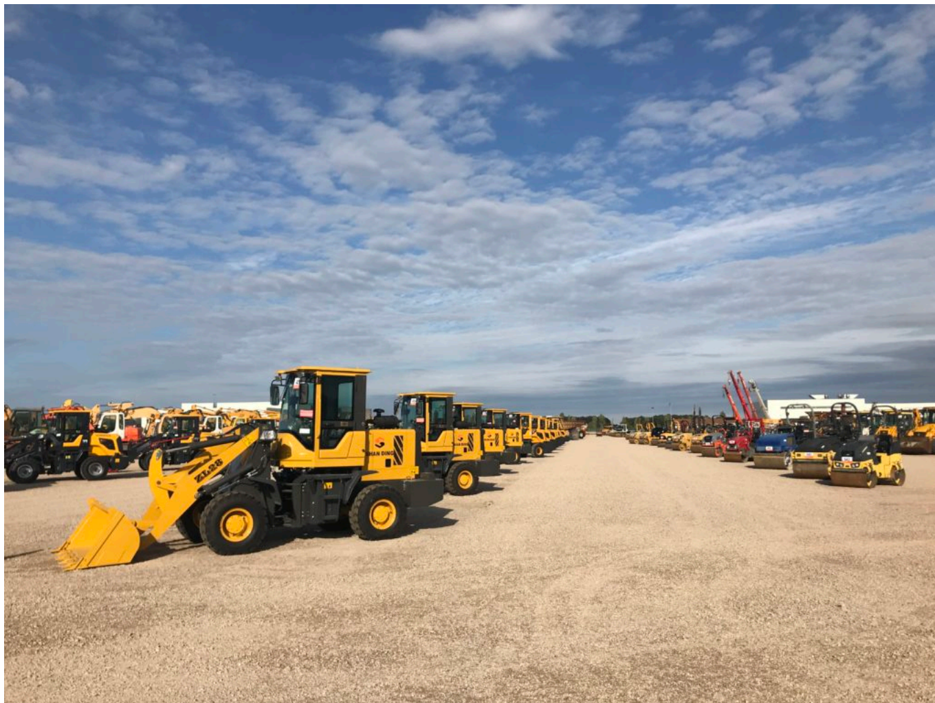
Parc de gestion à Avignon.