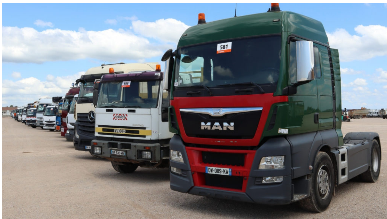
Parc de gestion à Avignon.

En 2021, pour pallier la distance induite par le digital, Ritchie Bros souhaite se rapprocher de ses clients en renforçant sa présence sur le territoire national. grâce à ses 4 sites en France. L'entreprise souhaite ouvrir prochainement de nouveaux sites satellites pour homogénéiser son maillage sur le territoire. « Au-delà du lien régional entre le commercial et ses clients, l'ouverture de nouveaux sites en France permet une diminution des coûts de transport. Chaque vendeur entretient une relation particulière avec son commercial qui lui est rattaché. Le commercial conseille son vendeur en mettant à profit son expertise et sa connaissance du marché pour déterminer la valeur de l'équipement mis en vente ». Afin d'accompagner encore mieux ses clients, Ritchie Bros souhaite renforcer ses équipes commerciales. Aujourd'hui composée de 7 commerciaux, l'équipe recrute de nouveaux collaborateurs au Nord-Est et au secteur agricole.