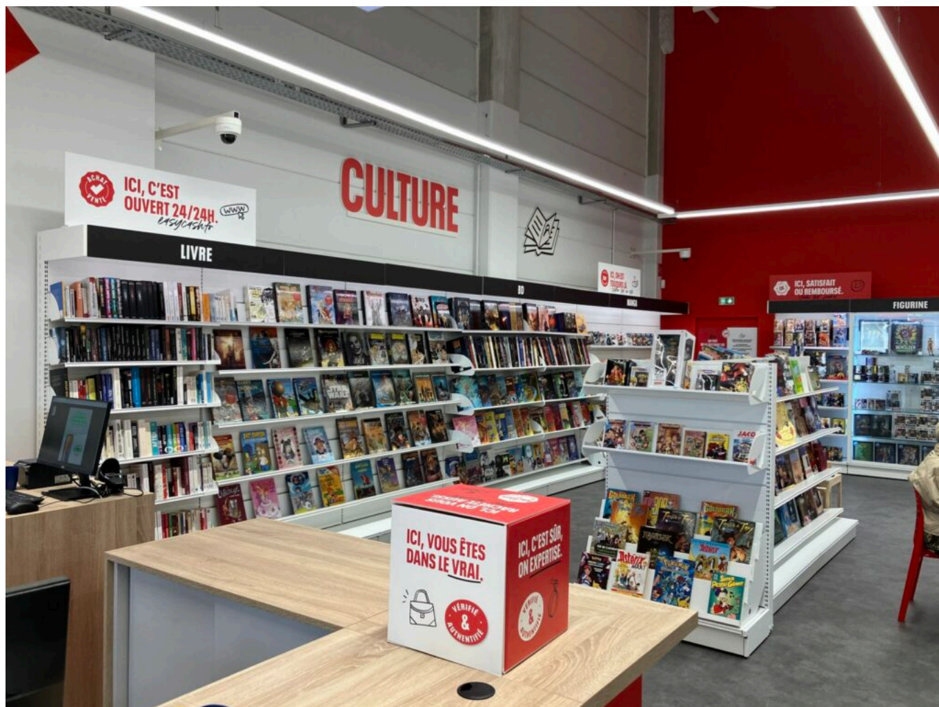
Le magasin d'Avignon.