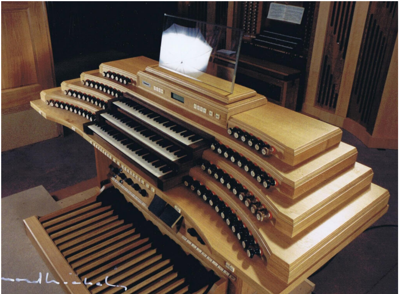
Console de l'orgue d'Hamamatsu