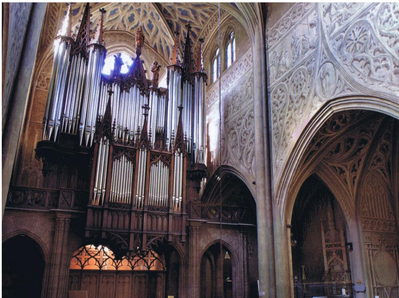
Cathédrale de Chambéry