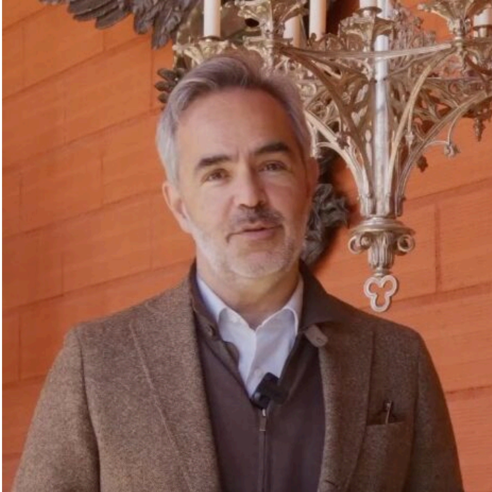
Régis Mathieu

quand la flèche conçue par Eugène Viollet-le-Duc en 1859 s'est brisée et quand la voûte s'est écroulée.