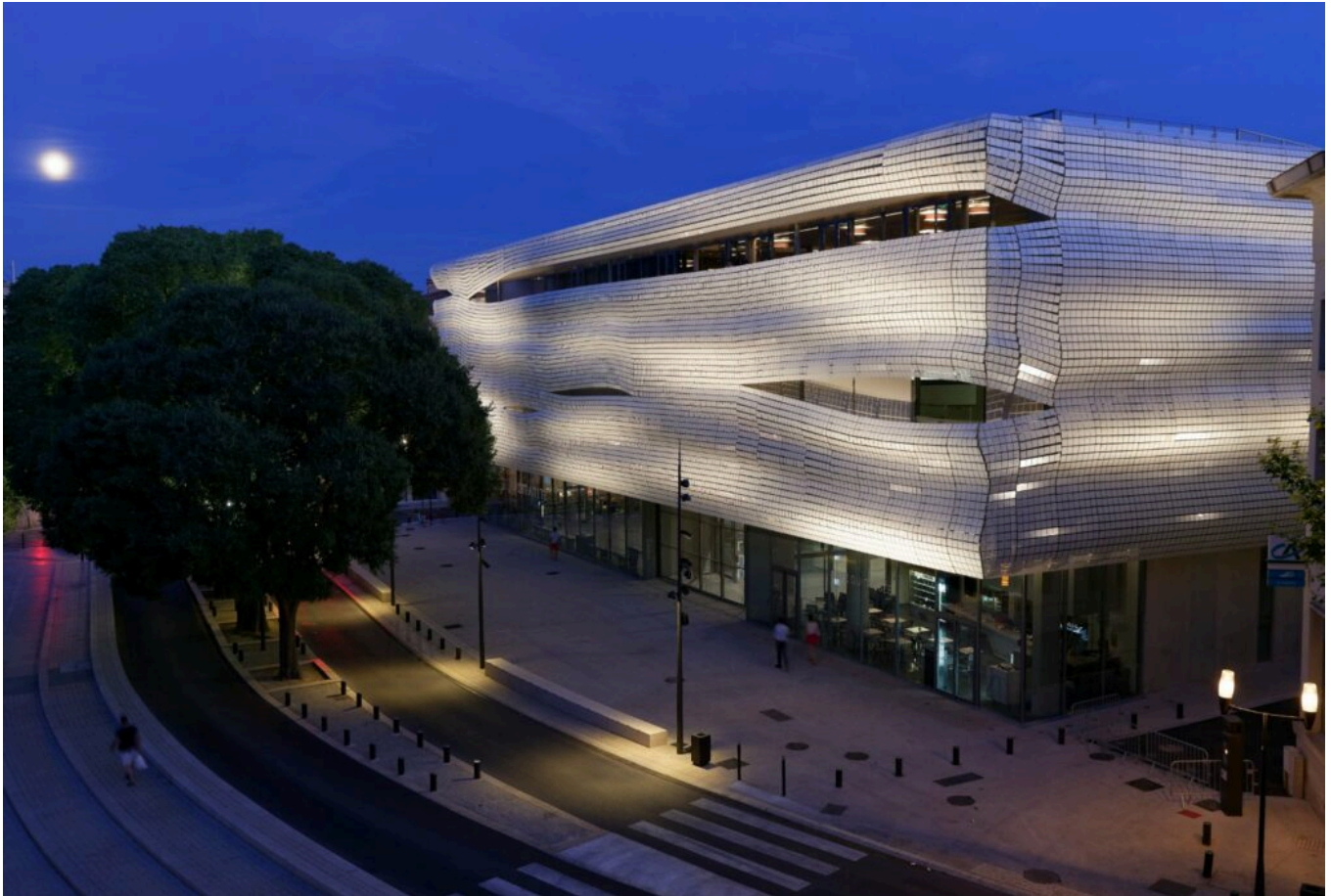
Le Musée de la Romanité.