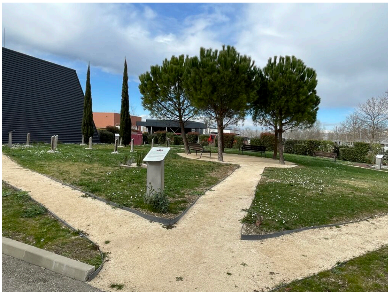
Le jardin du souvenir