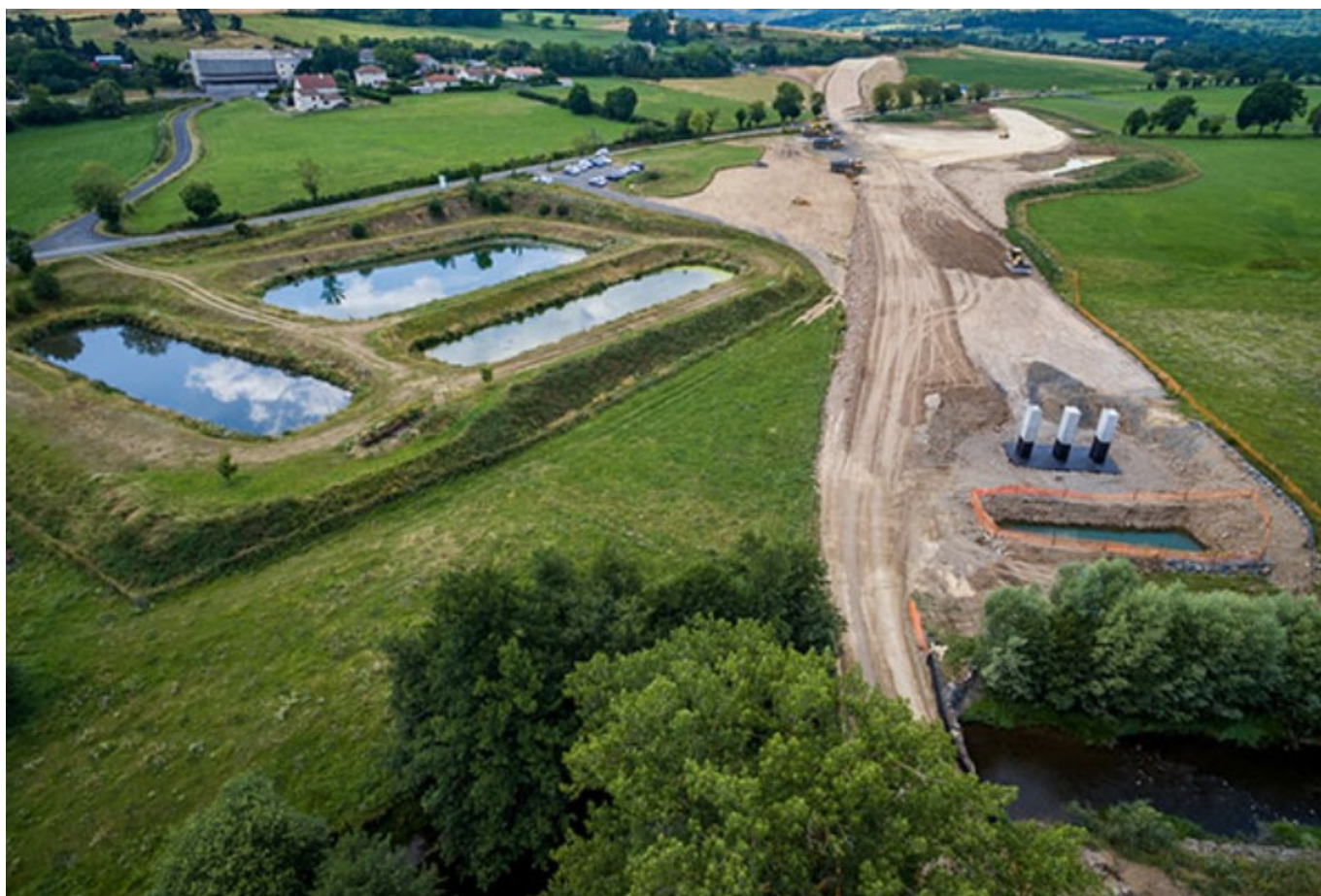
Travaux NGE