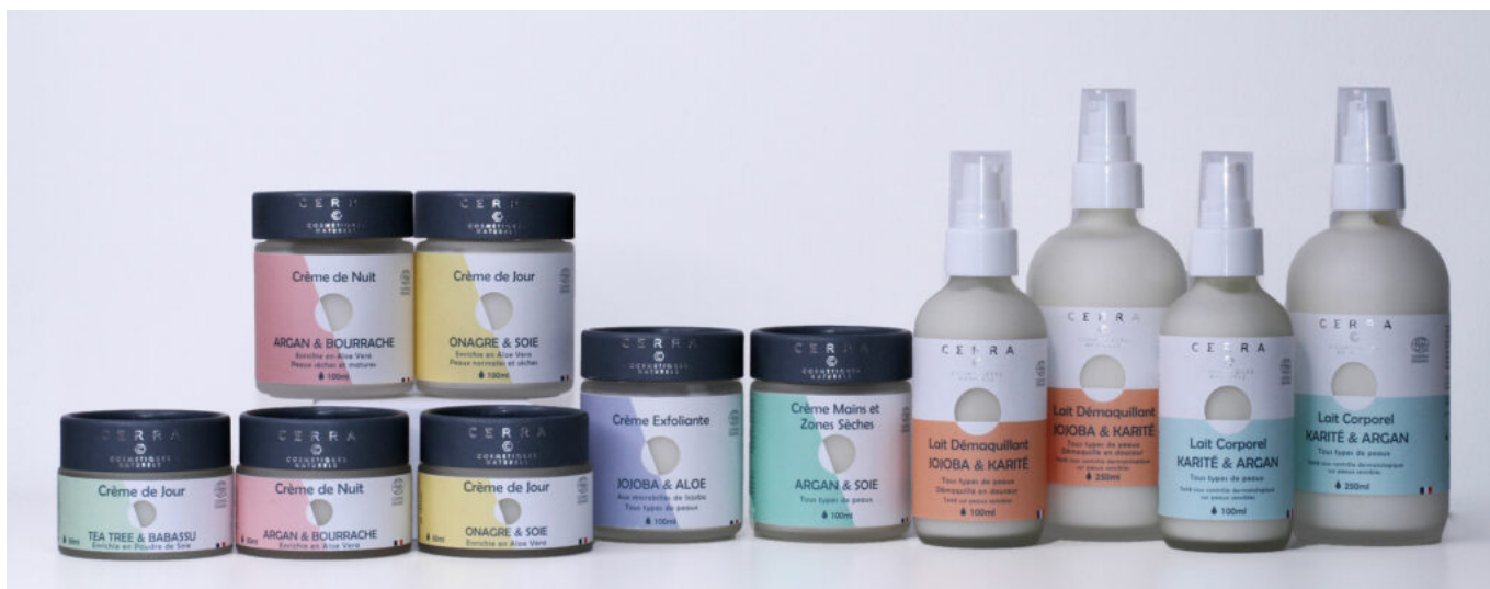
Une partie des produits Cerra.