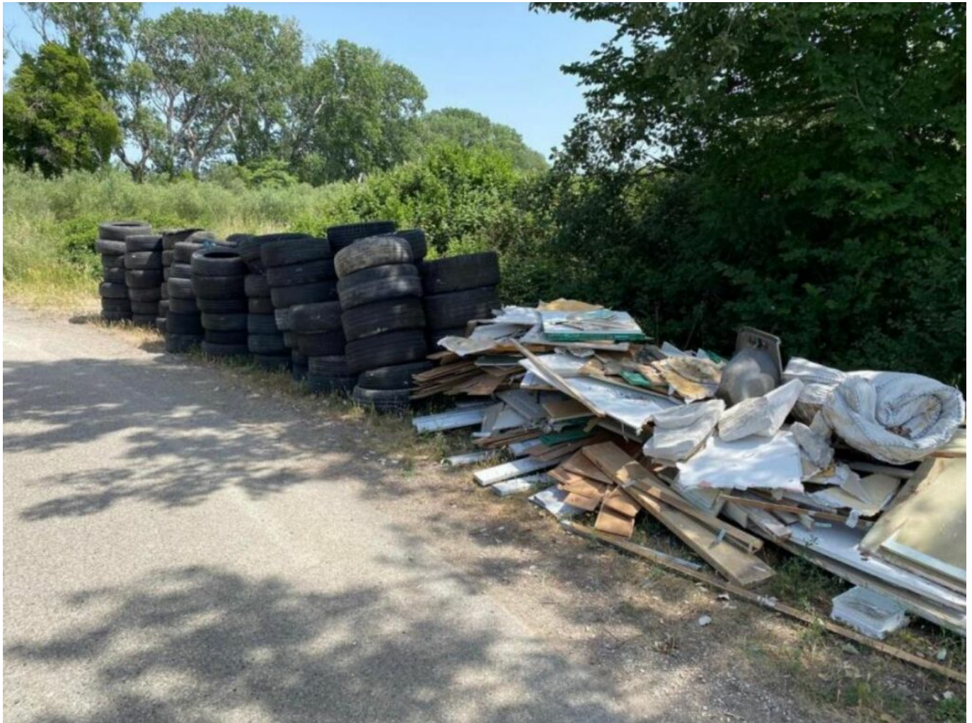
Déchets sortis d'un champ d'Olivier lors du grand nettoyage 2022

L'association de sauvegarde de la Ceinture Verte d'Avignon organise ainsi, pour la troisième année consécutive, une nouvelle opération de nettoyage de la Ceinture Verte, ce dimanche 14 mai, de 9h à 12h. Les outils et instructions nécessaires pour ramasser les déchets seront fournis aux participants s'étant inscrits à l'adresse suivante : communication.ascva@gmail.com