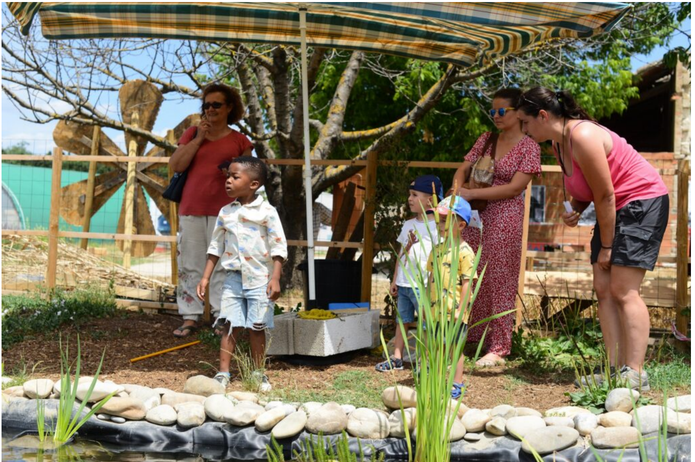
Atelier Découverte des habitants de la mare

Semilles permet à des femmes et des hommes de peaufiner leur projet d'emploi ou de formation tout en étant dans l'action, grâce aux activités de maraîchage et d'éducation à l'environnement et au développement durable (EEDD). « Vous avez besoin de légumes, ils ont besoin d'un travail. Ensemble cultivons la solidarité », telle est la politique de l'association. Chaque semaine, ce sont 350 avignonnais qui achètent les paniers proposés par l'association.