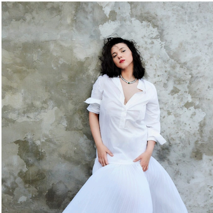
Khatia Buniatishvili.