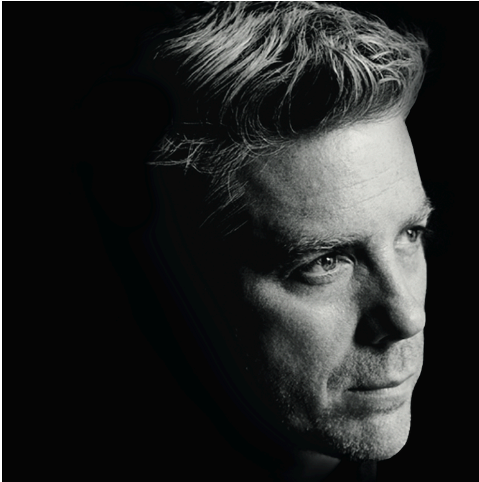
Kyle Eastwood.

Le 24 juillet, pour la clôture de l'édition 2023 des Chorégies, un duo de feu, un couple à la ville comme à la scène : la plus grande soprano actuelle Anna Netrebko et son époux le ténor Yusif Eyvazov. Ce sera là aussi une 1ère pour Orange. Jean-Louis Grinda ne cache pas son plaisir : « C'est la plus belle voix de la planète, elle a une couleur unique, un timbre splendide, une technique de folie, elle chante 'Aïda' et 'Turandot' sans forcer, vous vous rendez compte! Nous avons beaucoup de chance de les avoir tous les deux, ce sont des artistes avant tout, passionnés par leur art, ils adorent chanter sur scène, ils sont transcendés par le public, , enivrés comme Robert Alagna quand il vient à Orange, ils donnent tout, c'est absolument magique ». Au programme Verdi, mais il n'est pas encore défini !