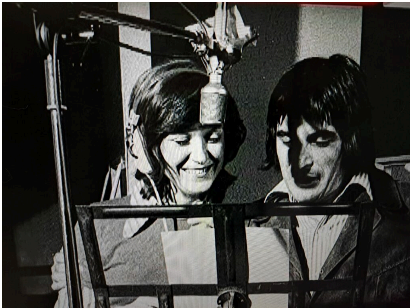
En Studio avec Serge Lama.