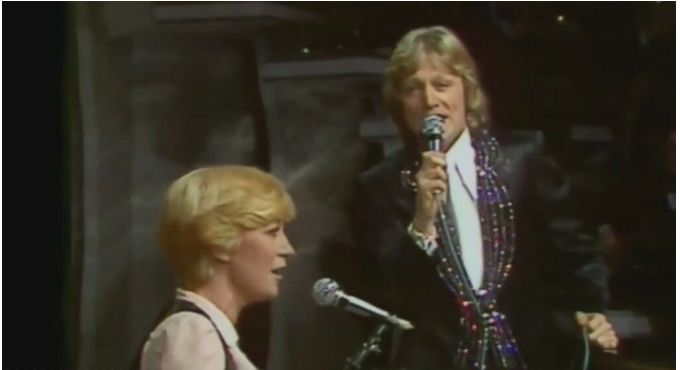
Alice Dona en duo avec Claude François.